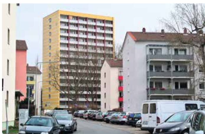
Albert-Schweitzer-Siedlung Wohnhochhaus

Zustellhotline: Tel. 06104-4970-0 Mo. – Fr. 8.00 – 16.30 Uhr