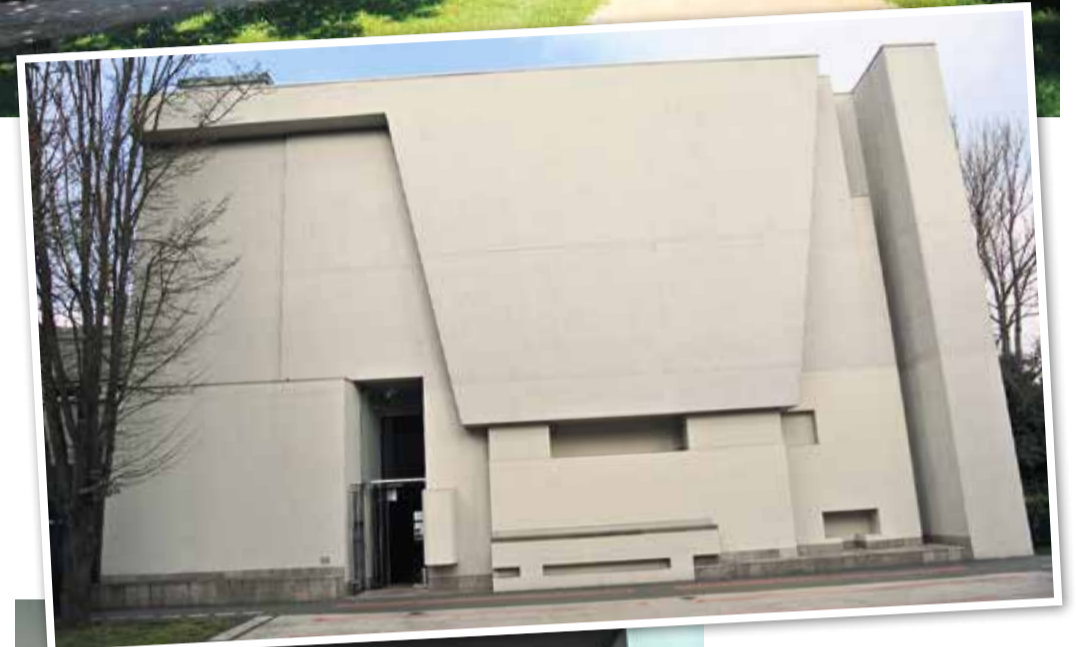
Die Dornbuschkirche und Innenraum der Dornbuschkirche.

Die Dornbuschkirche, ein architektonisches Highlight des Stadtteils, vereint auf beeindruckende Weise Tradition und Moderne. Ursprünglich 1960 erbaut, erfuhr sie 2004 eine radikale Umgestaltung durch die Frankfurter Architekten Meixner Schlüter Wendt. Das Ergebnis ist ein faszinierender Kontrast: Während der ursprüngliche Altarraum erhalten blieb, entstand ein völlig neuer, lichtdurchfluteter Kirchenraum. Das Herzstück bildet ein atemberaubendes, 20 Quadratmeter großes Buntglasfenster an der Nordwand, das die Kirche in ein Spiel aus Licht und Farben taucht. Der freistehende Glockenturm, ein Wahrzeichen Dornbuschs, dient als Mittelpunkt für Gemeindeveranstaltungen wie den beliebten Weihnachtsmarkt. Die Dornbuschkirche ist nicht nur ein Ort der Besinnung, sondern auch ein Beispiel für gelungene Kirchenarchitektur des 21. Jahrhunderts.