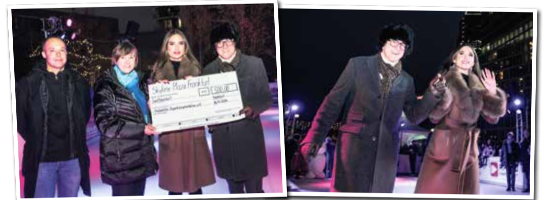
Scheckübergabe des Skyline Plaza an die Kinderhilfe Organtransplantation.