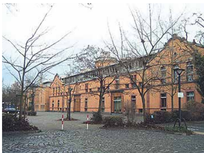
Der Bertramshof, Westseite