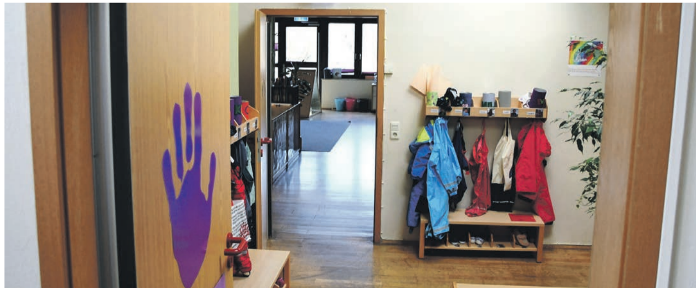
Blick in einen der Gruppenräume der Eppertshäuser Kita St. Sebastian. Familien müssen sich ab Januar auf höhere Frühstücks- und Verpflegungsentgelte sowie steigende Betreuungskosten im U3- wie Ü3-Bereich einstellen.

Die Jugendfeuerwehr trifft sich montags von 18 – 19.30 Uhr im Feuerwehrhaus. Mitmachen können Jugendliche von 10 bis 17 Jahren.