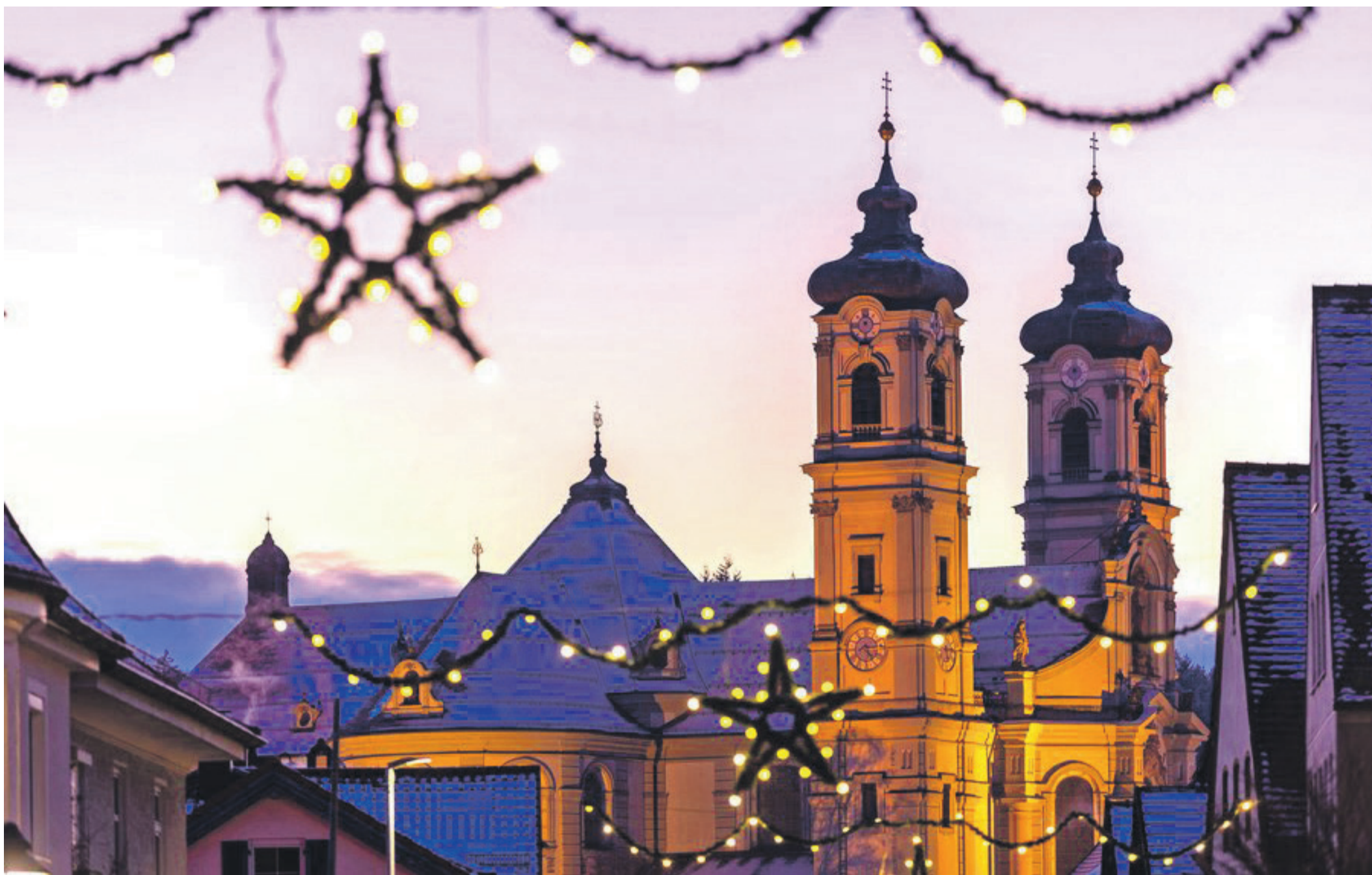
Die barocke Basilika in Ottobeuren ist ein hervorragender Klangraum, in der auch in der Adventszeit Konzerte stattfinden