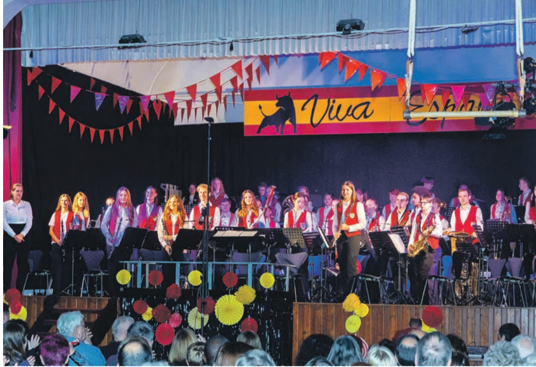
Das Kinder- und Jugendblasorchesterzusammen auf der Bühne.