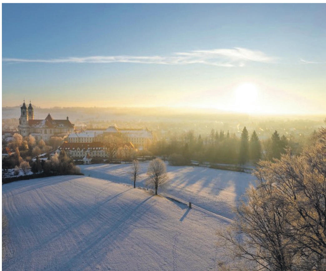
Rund um Ottobeuren laden Winterwanderwege und Loipen zum Krafttanken und Erholen ein.

Bei entsprechender Schneelage werden sogar Langlaufloipen auf dem Höhenrücken bei Ottobeuren und im Günztal gespürt.