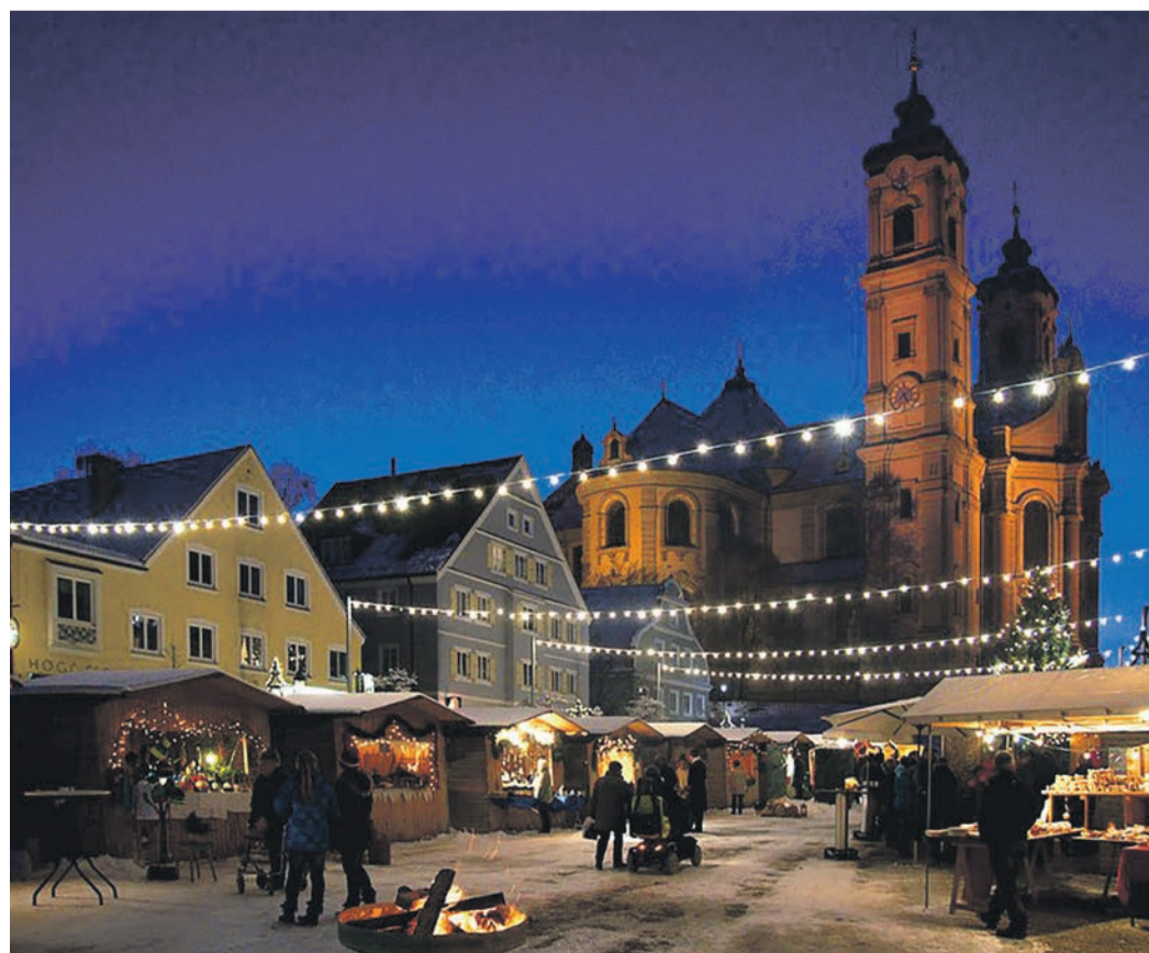
Der Weihnachtsmarkt auf dem Ottobeurer Marktplatz ist Jahr für Jahr ein sinnliches Erlebnis.