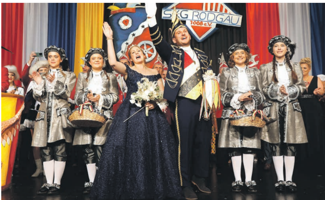
Die neuen närrischen Herrscher grüßen ihr begeistertes Volk.

Unabhängiges Wochenblatt · Amtsverordnungsblatt der Stadt Rodgau