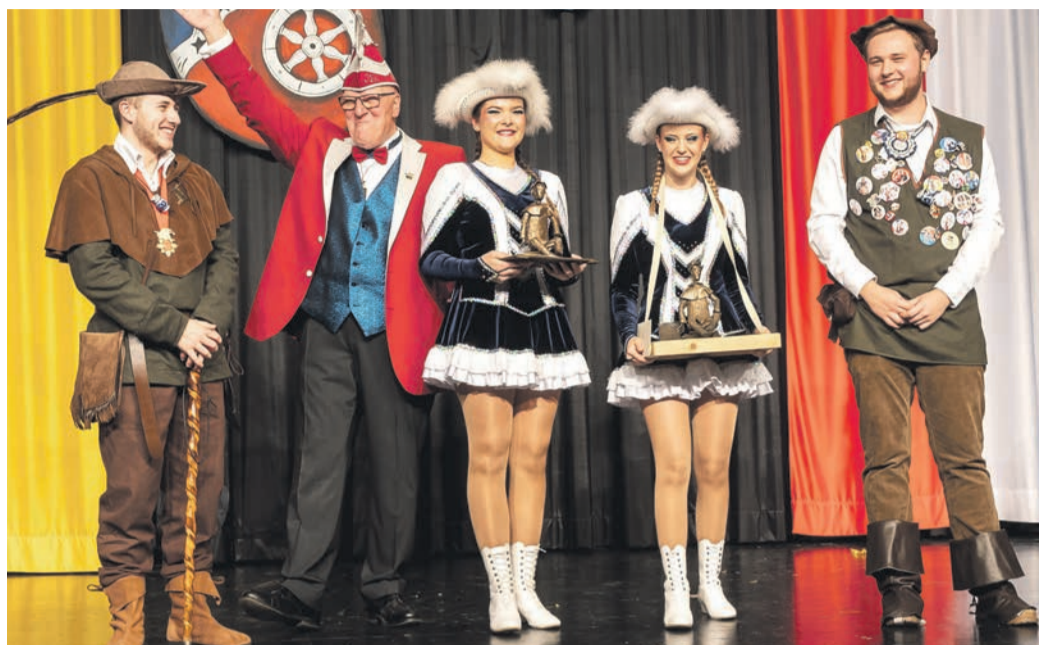
Der Förderpreis der Giesemer Fastnacht ging an zwei junge Damen. Beim Gugi fand eine Stabübergabe statt.