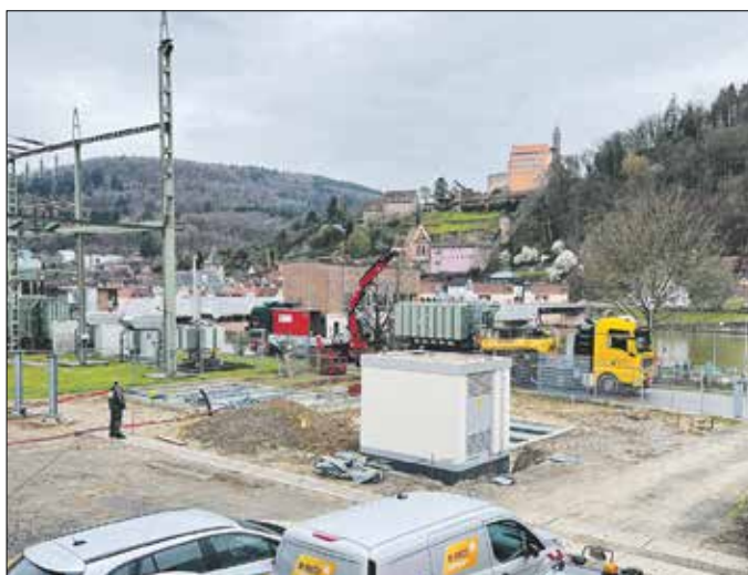
Ein Spezial-Schwertransport brachte den Transformator über die kurve und teilweise beengte Strecke sicher ans Ziel.

So wurde auch die Zukunft der Stromversorgung im Neckartal neu aufgestellt: Mit dem Anschluss eines neuen Transformators wurden eine ganz Reihe umfangrei-