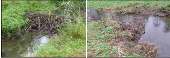
Ende September 2024: Intakter Biberdamm am Sandbach. Mitte November 2024: Zerstörter Biberdamm.

RIEDSTADT – Anfang der 1990er Jahre wurde der Lehrbruch in Crumstadt vom Wasserverband Modaugebiet auf Basis einer Planung des Ingenieurbüros Linke aus Riedstadt renaturiert. Dem Sandbach wurde in diesem Bereich die Möglichkeit gegeben, innerhalb des eingedeichten Bereiches frei zu mäandrieren.