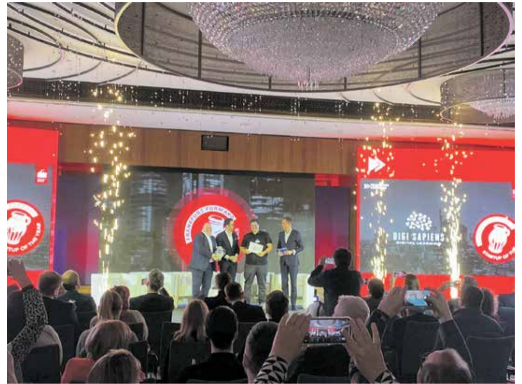
Preisverleihung an den Gewinner Digi Sapiens.

Die offizielle Bewerbungsphase für Startup of the Year 2025 beginnt am Sonntag, 1. Dezember. Mehr Infos zu Frankfurt Forward gibt es unter frankfurtforward.com