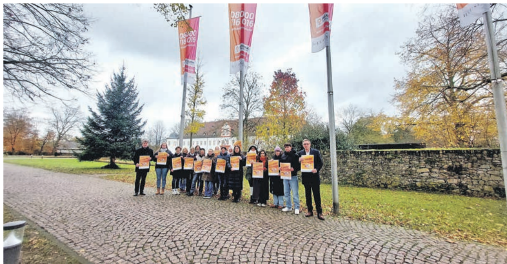
Mitarbeitende aus dem Rathaus unterstützen die Mitmachaktion des Hilfefonens und die Botenschaft „Wir brechen das Schweigen“.

Mit der Kampagne „Wir brechen das Schweigen“ soll auch