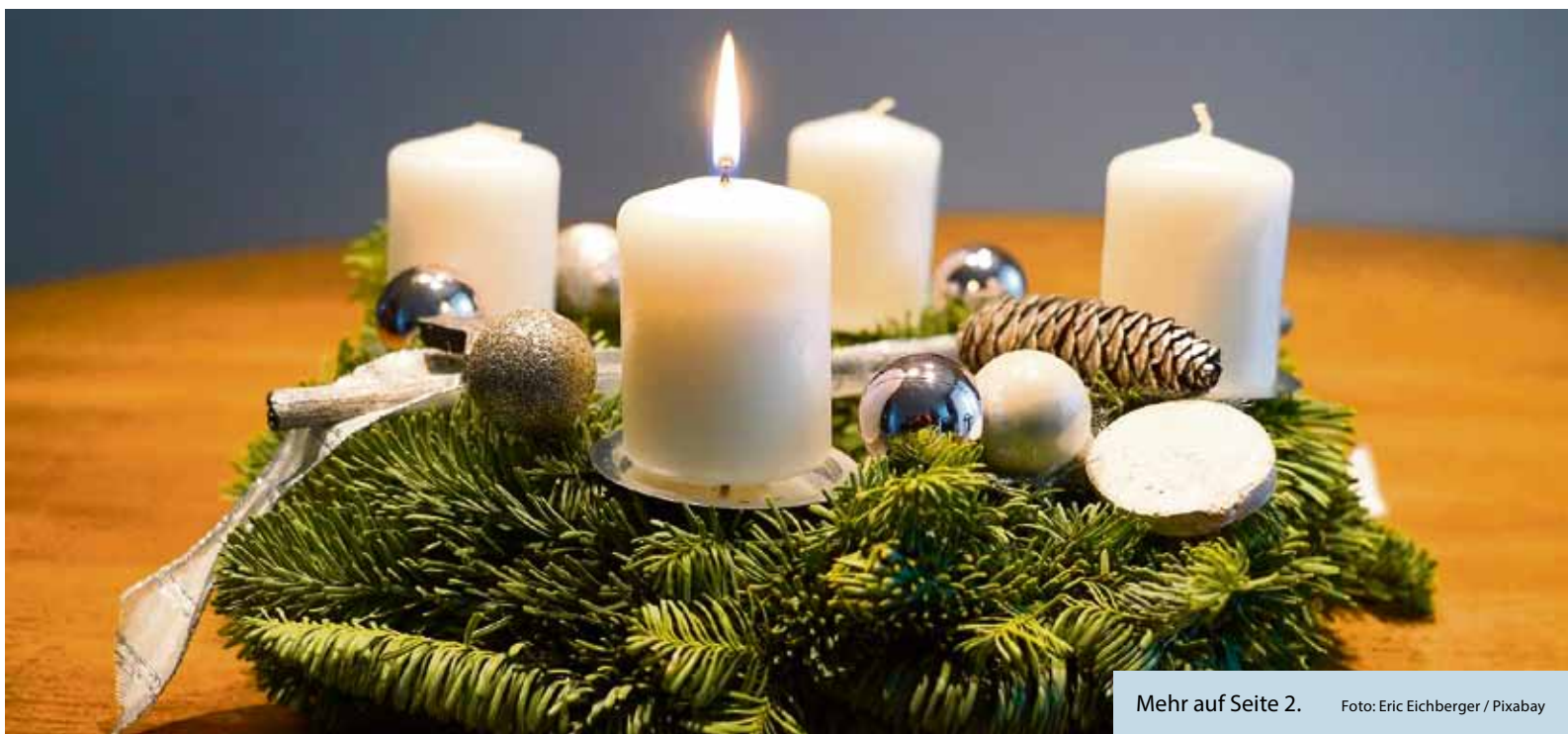
Mehr auf Seite 2.