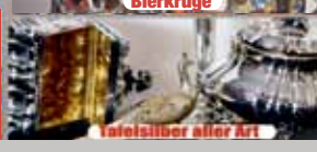
Silber aller Art

Ankauf von hochwertigen Uhren wie z.B. Rolex, Breitling, Omega, Ebel etc. gerne auch defekt.