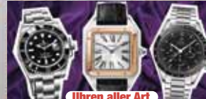
Uhren aller Art

Ihre Vorteile: ✓ kostenlose Beratung ✓ kostenlose Wertschätzung ✓ transparente Abwicklung ✓ Bargeld sofort