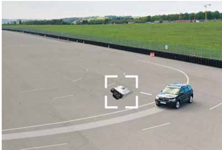
Immer in der Spur bleiben: Moderne Technik sorgt dafür, dass auch im Fall eines Kurzschlusses das Fahrzeug manövrierfähig bleibt.

Eine zuverlässige und jederzeit sichere Energieversorgung sowie deren permanente Überwachung ist besonders wichtig, damit Funktionen wie die elektrische Bremskraftverstärkung, Servolenkung, Licht oder Scheibenwischer uneingeschränkt zur Verfügung stehen.