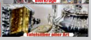
Tafelsilber aller Art

Ankauf von hochwertigen Uhren wie z.B. Rolex, Breitling, Omega, Ebel etc. gerne auch defekt.