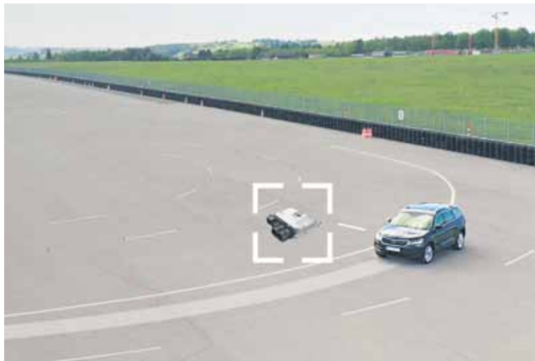
Immer in der Spur bleiben: Moderne Technik sorgt dafür, dass auch im Fall eines Kurzschlusses das Fahrzeug manövrierfähig bleibt.

Eine zuverlässige und jederzeit sichere Energieversorgung sowie deren permanente Überwachung ist besonders wichtig, damit Funktionen wie die elektrische Bremskraftverstärkung, Servolenkung, Licht oder Scheibenwischer uneingeschränkt zur Verfügung stehen.