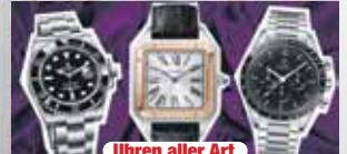
Uhren aller Art

Ihre Vorteile: ✓ kostenlose Beratung ✓ kostenlose Wertschätzung ✓ transparente Abwicklung ✓ Bargeld sofort