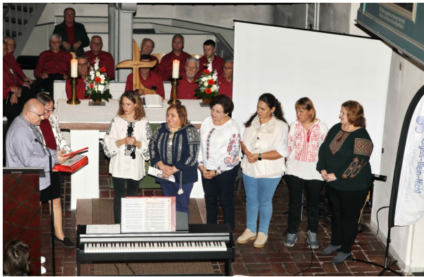
Vorne rechts Mitarbeiterteam aus Ivanychi

Ein rundes Jubiläum, das tief berührte: Der gemeinnützige Verein „Vergiss-Mein-Nicht e.V.“ feierte sein 20-jähriges Bestehen. Gegründet, um die Menschen in Ivanychi in der Ukraine - Partnerstadt der Gemeinde Erzhausen - zu unterstützen, blickt der Verein auf zwei Jahrzehnte kontinuierlichen Engagements zurück. Der Verein organisierte zwei Tage voller Feierlichkeiten, die tiefe Wertschätzung für die Freundschaft und Zusammenarbeit zwischen Erzhausen und Ivanychi zum Ausdruck brachten.