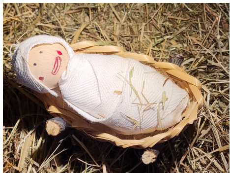
Ute Depenbrock und Simone Weil

Wir freuen uns auf alle, die dabei sind.