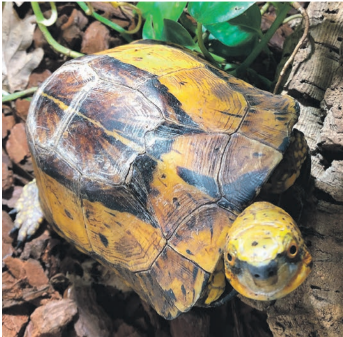
Eine chinesische Erdschildkröte.

den die Tiere wenig später aus Verzweiflung oder Überforderung weggegeben. Oder noch schlimmer: ausgesetzt. Auch die Energiepreise sollte man im Blick haben. Denn viele exotische Tiere sind wegen ihrer Herkunft auf meist höhere Temperaturen angewiesen, die nur mit spezieller Ausstattung erreicht werden können. Hinzu kommt, dass einige Arten wie Schildkröten sehr alt werden können, sodass man sich für viele Jahre oder sogar Jahrzehnte um sie kümmern muss – als Eltern auch dann, wenn die Kinder schon lange aus dem Haus sind. Auch die erheblich gestiegenen Tierarztkosten sollten bedacht werden. Des Weiteren weisen die RP-Fachkräfte auf die Meldepflicht artgeschützter Tiere hin. Schließlich stehen die genannten Tiere wie viele weitere Wirbeltiere unter Artenschutz und unterliegen zahlreichen gesetzlichen Auflagen,