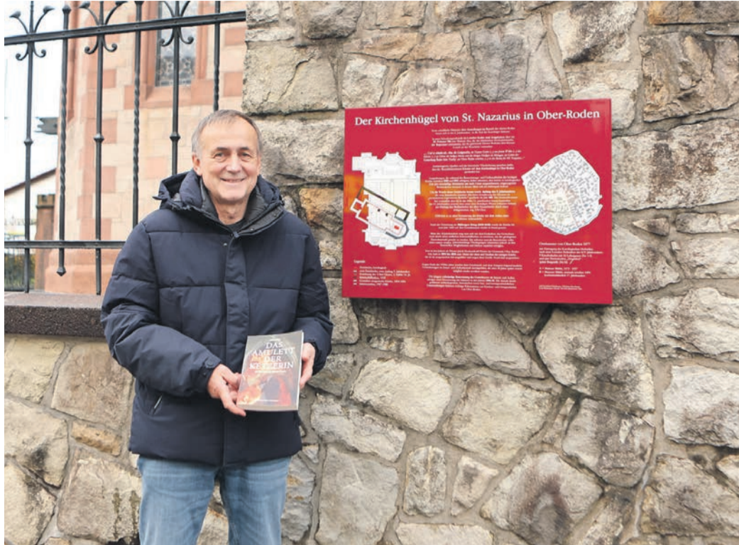
„Das Amulett der Ketzerin - Der Untergang des Klosters Rotaha“ heißt das neue Buch von Arno Mieth.

Ein Blick in den Inhalt des 296 Seiten starken Romans: „Tief unter der Oberfläche im Kirchgarten des Rodgaudoms St. Nazarius werden die Ruinen des untergegangenen Klosters Rotaha vermutet. Bauarbeiter finden beim Verlegen von Drainagen im Untergrund des Kirchgartens ein Skelett. In dessen Brustkorb ist ein Amulett verborgen, mit kryptischen Texten auf den Oberflächen. Die Hessische Landesarchäologin Dr. Eleonore Stallmeister untersucht das Amulett in ihrem Büro im „Jägerhaus“. Sie erhält Besuch eines mysteriösen Fremden, der schließlich das Amulett raubt und dabei die Landesarchäologin schwer verletzt. Eine internationale kriminelle Vereinigung der Gegenwart und ein Nachkomme eines Tempelritter-Ordens ringen um den Fund in Ober-Roden, zuletzt in der kleinen Ortschaft Cattolica Eraclea, in den