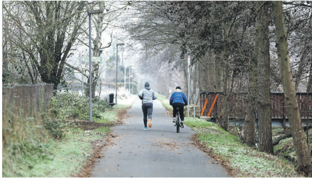
Das Fuß- und Radverkehrskonzept soll bis zum Sommer 2026 fertig sein.

Rödermark (PS) - Das Darmstädter Planungsbüro „VAR+“ soll im Auftrag des Magistrats bis zum Sommer 2026 ein Fuß- und Radverkehrskonzept für Rödermark erstellen. Seit kurzem ist auch eine Online-Bürgerbeteiligung freigeschaltet. Kern des Konzepts ist die Entwicklung eines „Radverkehrsnetzes“, um die Hauptverbindungen für den Radverkehr herauszuarbeiten, sodass diese sinnvolle Maßnahmen zur Förderung des Radverkehrs zugeordnet werden können. Dabei sollen auch Lücken im Netz identifiziert werden, an denen neue Wege entstehen könnten. An das Radverkehrsnetz, das sogenannte „Pendlerlinien“ (Raddirektverbindungen) und „Basisrouten“ sowie ein Nebenetz umfasst, sollen über 90 Prozent der Bewohner der Stadt angeschlossen sein. Diese Zielsetzung formulierte Pirmin Haas von „VAR+“ kürzlich in einer Sitzung des Ausschusses für Bau, Umwelt, Stadtentwicklung und Energie. Pendlerlinien sollen ein zügiges Fahren zur Arbeit oder zum Bahnhof ermöglichen, etwas langsamer ist man auf den Basisrouten zwischen den Stadtteilen, etwa zur Schule oder zum Einkaufen unterwegs. Das Planungsbüro hat neben der Raddirektverbindung durch den Kreis von Eppertshausen durch Ober-Roden Richtung Offenbach in Rödermark sechs Pendlerlinien ausgemacht. Beispielsweise von Messel über den Biengarten oder von Offenbach durch Urberach nach Ober-Roden oder von Ober-Roden abseits der Hauptstraßen über Waldacker nach Dietzenbach.