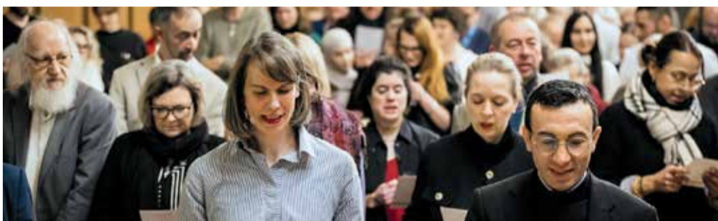
Auch die Gäste sangen gemeinsam mit Pop-Chor „Mainstimmig“ im Kaisersaal.

FRANKFURT (PM) | Das ausdauernde Engagement von ehrenamtlich engagierten Frankfurterinnen und Frankfurtern hat Oberbürgermeister Mike Josef am 5. Dezember anlässlich des Internationalen Tags des Ehrenamts, während eines vorweihnachtlichen Empfangs im Kaisersaal gewürdigt. Zum Internationalen Tag des Ehrenamts, der 1985 von den Vereinten Nationen ausgerufen wurde und jedes Jahr am 5. Dezember stattfindet, stand in diesem Jahr der Themenbereich