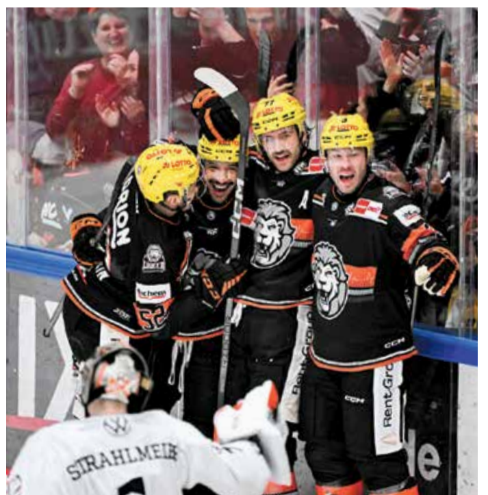
Torjubel vor eigenem Publikum: Bis zu den Weihnachtsfeiertagen müssen die Löwen nun auswärts ran.

furt: www.loewen-frankfurt.de/tickets Das DEL WINTER GAME ist seit vielen Jahr ein wiederkehrendes Event der ersten Eishockey-Liga, die ein reguläres Liga-Punktspiel in einem Fußballstadion veranstaltet. Die Frankfurter Bewerbung konnte sich für diese Saison durchsetzen, sodass im Deutsche Bank Park der Rasen durch die weiße Eisfläche ausgetauscht wird.