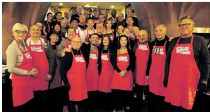
Team-Foto der knapp 40 prominenten „Kellnerinnen“ und „Kellner“ im Frankfurter Ratskeller.