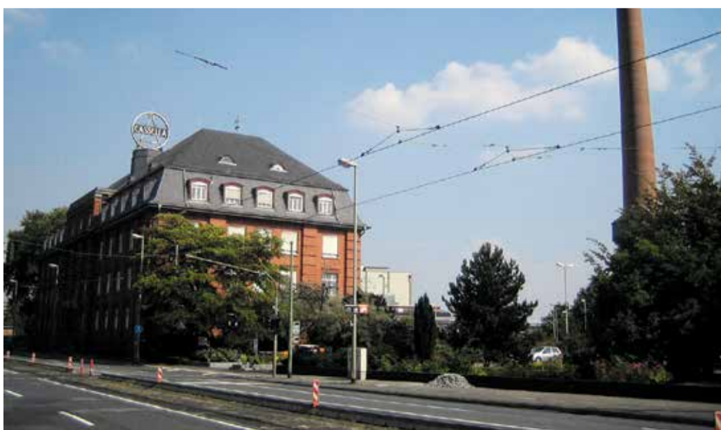
Das Hauptgebäude der Cassella-Werke

The Great Escape Frankfurt bietet spannende Live Escape Room Games für Abenteuerlustige jeden Alters. In verschiedenen thematisch gestalteten Räumen wie der „Gespenster Villa“ oder dem „Finsteren Mittelalter“ müssen Besucher in Teams innerhalb von 60 Minuten Rätsel lösen und Hinweise finden, um zu entkommen. Die klimatisierten Räume sorgen für ein angenehmes Spielerlebnis. Das Angebot eignet sich für Freunde, Familien, Touristen, Firmenteams und Schulklassen gleichermaßen. Mit Preisen ab 30€ pro Person (Mo-Do) ist es eine erschwingliche Freizeitaktivität, die Teamgeist und Kommunikation fördert. Besonders attraktiv sind die Angebote für Schulklassen und Firmen, die das Escape Room-Erlebnis für Teambuilding-Zwecke nutzen können. The Great Escape Frankfurt befindet sich in der Hanauer Landstraße 340 und empfiehlt, 15 Minuten vor Spielbeginn einzutreffen.