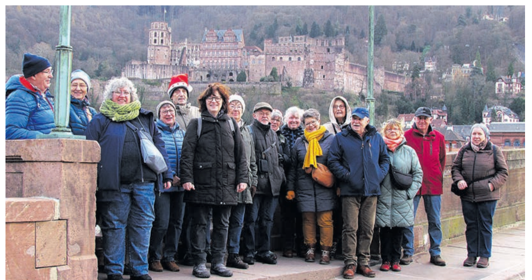
Die letzte Tour des Wandervereins in diesem Jahr führte am 2. Advent zum Weihnachtsmarkt nach Heidelberg. Am Neckarmüllenzplatz begann ein kleiner Spaziergang entlang am Neckar von rund 45 Minuten mit einem tollen Stadtpanorama. In der Altstadt angekommen hatten alle die Möglichkeit Weihnachtsmärkte an sechs verschiedenen Plätzen zu besuchen. Alle Teilnehmer waren begeistert und sind sich einig, es war wunderschöner 2. Advent.

derheim zum gemeinsamen Beisammen sein. Dann geht man in die Weihnachtspause. Am 3. Januar trifft man sich dann wieder von 9.30 Uhr bis 15 Uhr trifft sich der Fachbereich Kreativ im Wanderheim zum gemeinsamen Nähen, Häkeln, Sticken, Stricken, Basteln. Wer gerne seinem Hobby in gemüthlicher Gesellschaft nachgehen will, ist herzlich eingeladen, bei uns vorbeizuschauen! Ob Anfänger oder Fortgeschrittener – alle sind willkommen, gemeinsam neue Projekte anzugehen, Ideen auszutauschen und kreative Stunden zu verbringen.