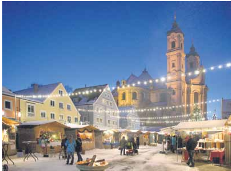
Der Weihnachtsmarkt auf dem Ottobeuerer Marktplatz ist Jahr für Jahr ein sinnliches Erlebnis.

Im südlichen Querschiff der Basilika kann vom ersten Advent bis zum Dreikönigstag am 6. Januar wieder die Krippenlandschaft mit bis zu 230 Menschenfiguren und 300 Tieren bewundert werden. In Mu-