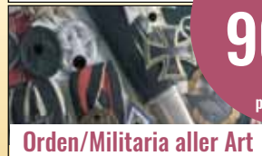
Orden/Militaria aller Art