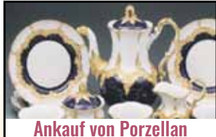
Ankauf von Porzellan