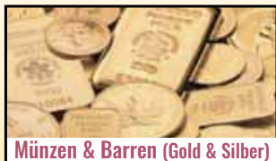
Münzen & Barren (Gold & Silber)