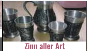
Zinn aller Art

Ihre Vorteile: ✓ kostenlose Beratung ✓ kostenlose Wertschätzung ✓ transparente Abwicklung ✓ Bargeld sofort