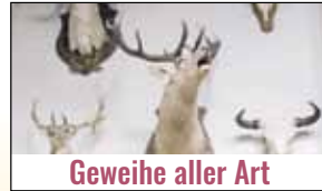
Geweide aller Art