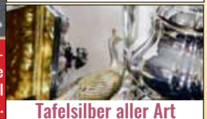
Tafelsilber aller Art