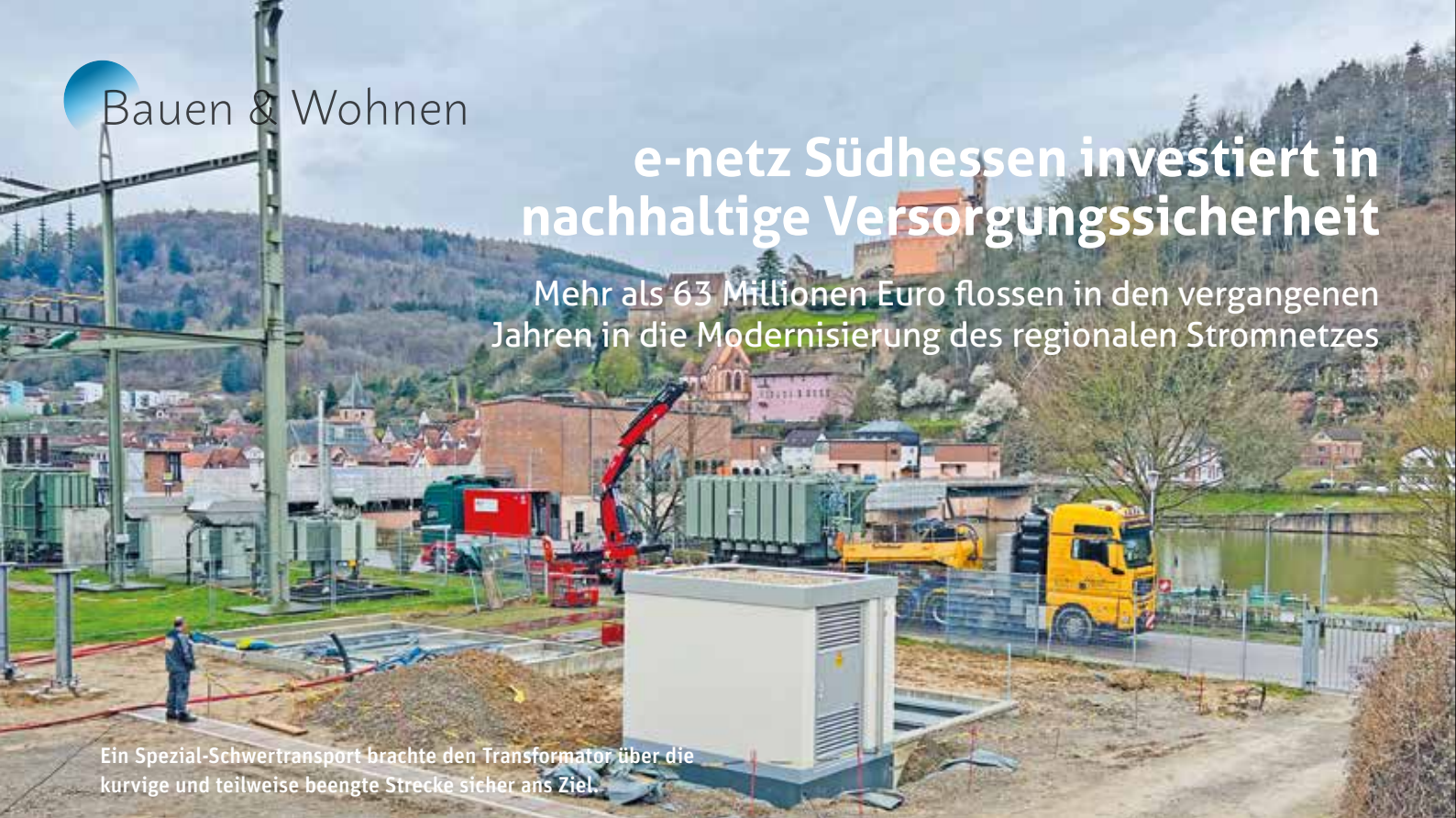
Ein Spezial-Schwertransport brachte den Transformator über die kurvige und teilweise beengte Strecke sicher ans Ziel.

Mehr als 63 Millionen Euro flossen in den vergangenen Jahren in die Modernisierung des regionalen Stromnetzes