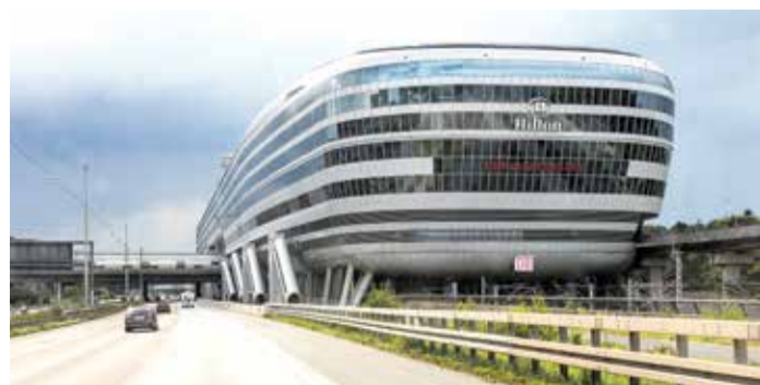
The Square am Flughafen