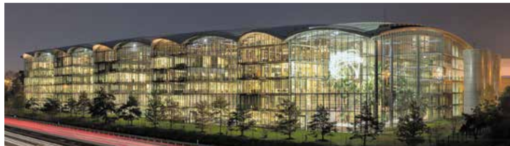
Lufthansa Aviation Center am Abend