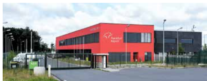
Feuerwache 4 am Flughafen

Der Flughafen Frankfurt, Herzstück des gleichnamigen Stadtteils, ist weit mehr als nur ein Transitort. Als eines der bedeutendsten Luftverkehrsdrehkreuze Europas bietet er Besuchern eine faszinierende Mischung aus Hightech und Internationalität. Die beiden Besucherterrassen in den Terminals 1 und 2 ermöglichen spektakuläre Ausblicke auf das geschäftige Treiben auf dem Vorfeld. Flugzeugbegeisterte können hier Maschinen aus aller Welt beim Starten und Landen beobachten. Das Besucherzen-