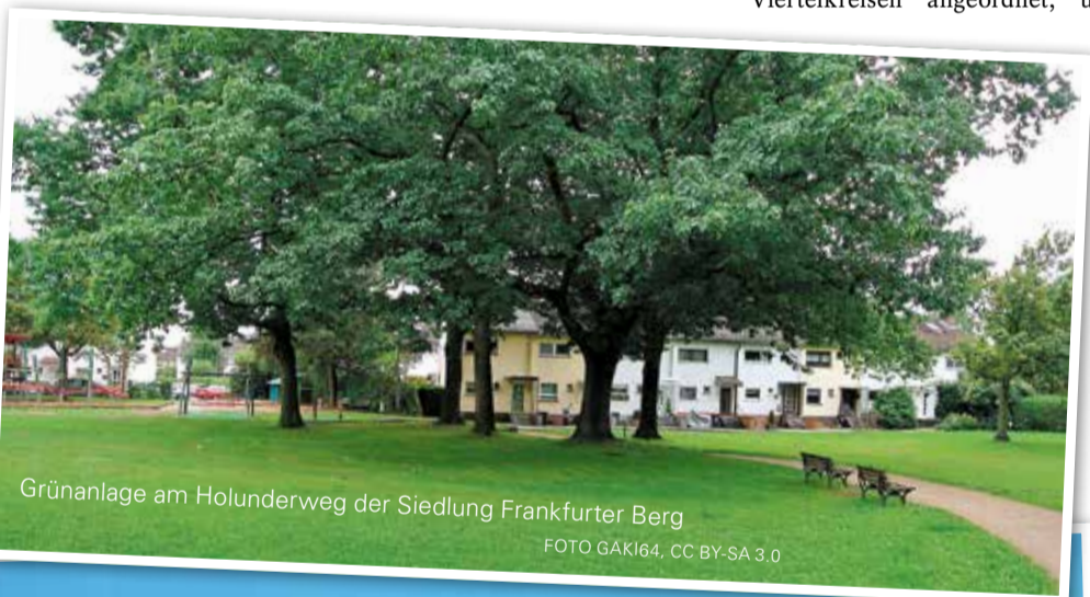
Grünanlage am Holunderweg der Siedlung Frankfurter Berg

Zustellhotline: Tel. 06104-4970-0 Mo. - Fr. 8.00 - 16.30 Uhr