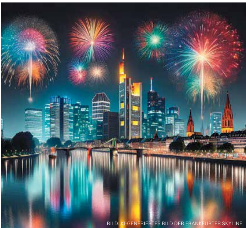
BILD: KI-GENERIERTES BILD DER FRANKFURTER SKYLINE

Perspektiven für einen hoffnungsvollen Jahreswechsel