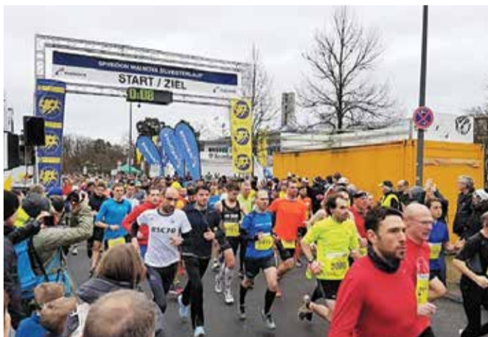
Mainova Spiridon Silvesterlauf.