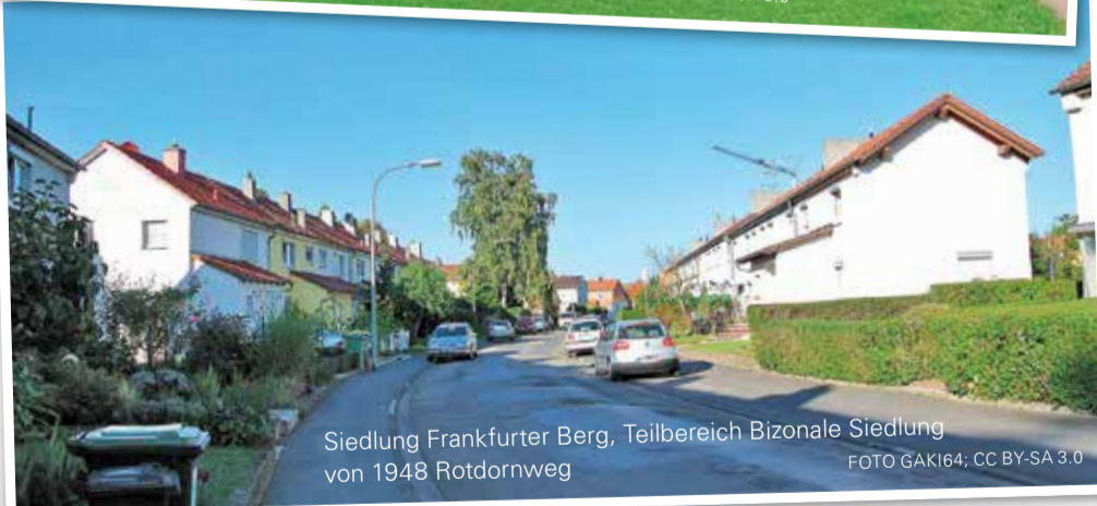
Siedlung Frankfurter Berg, Teilbereich Bizonale Siedlung von 1948 Rotdornweg