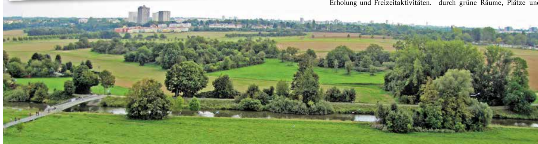
Frankfurter Berg vom alten Flugplatz in Bonames (aus Richtung Norden)