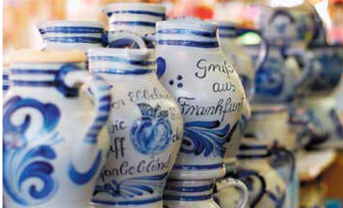
Bembel auf der Dippemess.

Zum Jahreswechsel findet am 29. Dezember der traditionelle Spiridon Mainova Silvesterlauf statt, bei dem die Teilnehmer 10 km durch den winterlichen Frankfurter Stadtwald laufen. Es ist der größte Silvesterlauf in Hessen.