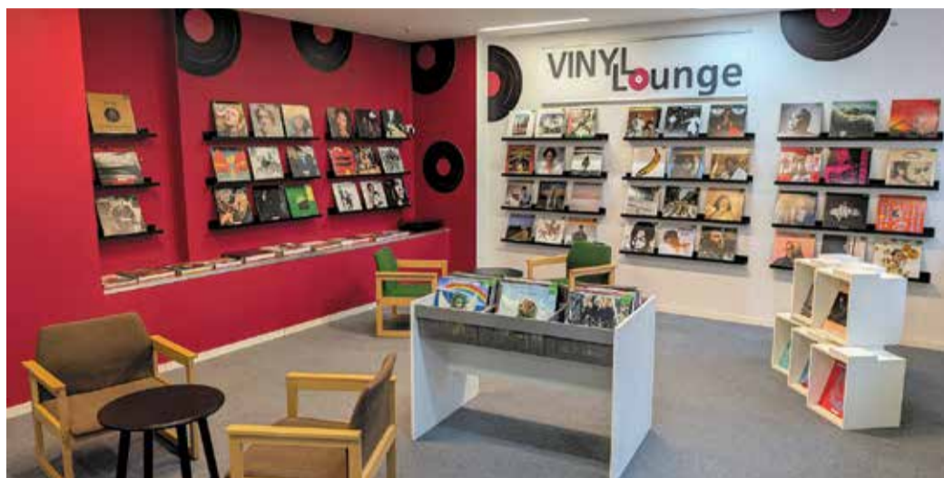
Die neue Vinyl-Lounge

gewählter Literatur über Vinyl-Kultur blättern, sich Platten vor Ort auf zwei Plattenspielern anhören oder die Scheiben ausleihen. Im Startbestand findet sich eine handverlesene Auswahl an Klassikern und Neuerscheinungen mit einem Schwerpunkt auf Rock, Pop, Hip-Hop und Indie.