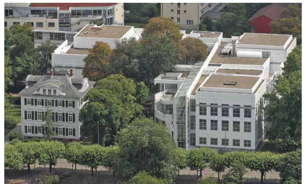
Museum für Angewandte Kunst (MAK).

können alle bis zum Alter von 18 Jahren auch nicht-städtische Museen besuchen. Weitere Informationen hierzu gibt es unter kufti.de