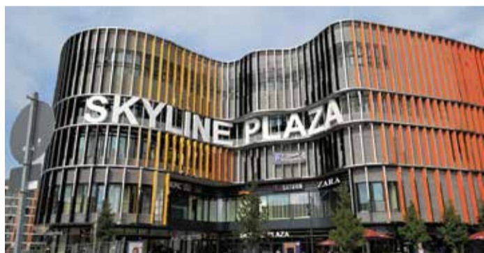
Das Skyline Plaza