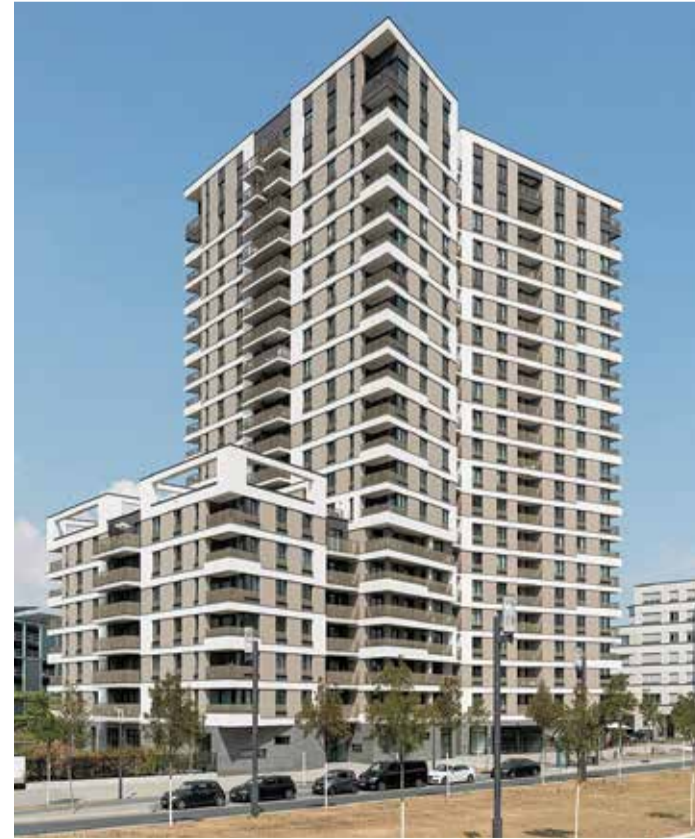
Das Westside Tower im Europaviertel

Suchen Sie eine Auszeit vom Großstadttreiben? Das MeridianSpa Skyline Plaza bietet auf 10.000 Quadratmetern Erholung pur mitten in Frankfurt. Tauchen Sie ein in die vielfältige Bade- und Saunalandschaft mit 20-Meter-Pool und Themensaunen. Das absolute Highlight: die 1.500 Quadratmeter große Dachterrasse mit atemberaubendem Skyline-Blick, ZEN-Garten und Sonnendeck. Verwöhnen lassen Sie sich im AMAYANA Day Spa, während Fitness-Fans unter 200 modernen Geräten und zahlreichen Kursen wählen können. Das MeridianSpa vereint urbanen Luxus mit Entspannung und ist der ideale Rückzugsort für alle, die eine Pause vom hektischen Stadtleben suchen.