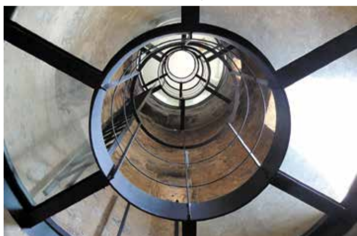
Innenraum der Galluswarte

Die Frankenallee ist eine bedeutende Straße und Grünanlage im Frankfurter Stadtteil Gallus. Als Teil der ehemaligen Frankfurter Wallanlagen erstreckt sie sich über 1,7 Kilometer und bildet eine grüne Achse durch den Stadtteil. Die Allee wurde Anfang des 20. Jahrhunderts angelegt und nach dem Volkstamm der Franken benannt. Sie verbindet den Hauptbahnhof mit dem Stadtteil Höchst und ist eine wichtige Verkehrsader. Gleichzeitig dient sie als beliebte Grün- und Erholungsfläche für die Anwohner. Entlang der Frankenallee finden sich zahlreiche Bäume, Rasenflächen und Spielplätze. Der breite Mittelstreifen lädt zum Spazieren, Joggen oder Verweilen ein. Besonders im