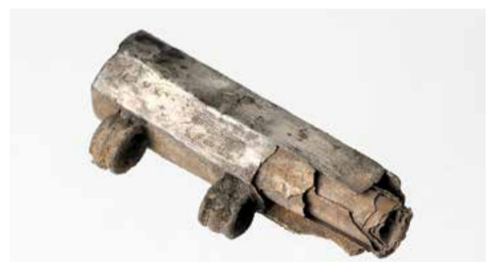
Abbildung des gerade einmal 3,5 Zentimeter großen Silberamuletts, in dem ein dünnes Silberblech mit geheimnisvoller Gravur eingerollt ist: Die „Frankfurter Silberinschrift“ (2),