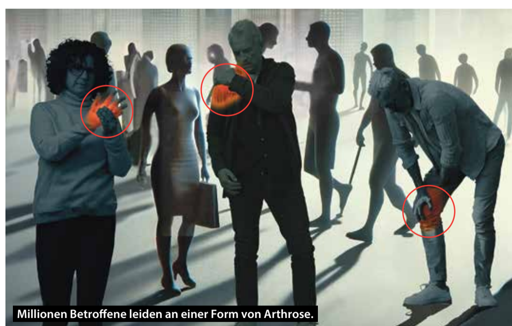
Millionen Betroffene leiden an einer Form von Arthrose.

Zunächst fällt es schwer, das Knie ganz durchzudrücken. Knack- und Reibegeräusche werden hörbar. Treppensteigen verursacht Schmerzen, die sich unter Belastung langsam steigern, aber auch plötzlich einschließen