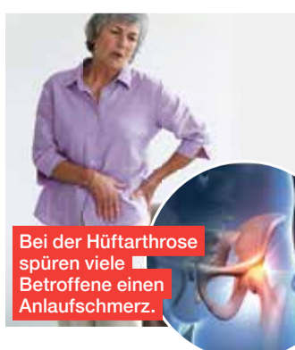
Bei der Hüftarthrose spüren viele Betroffene einen Anlaufschmerz.

Erste Anzeichen sind eingeschränkte Beweglichkeit und Schmerzen in der Leiste und im Gesäß. Mit fortschreitender Erkrankung beginnen die Betroffenen zu hinken, um das schmerzende Gelenk zu entlasten. Die Schmerzen machen einfache Handlungen wie das Binden von Schuhen zu einer Herausforderung.