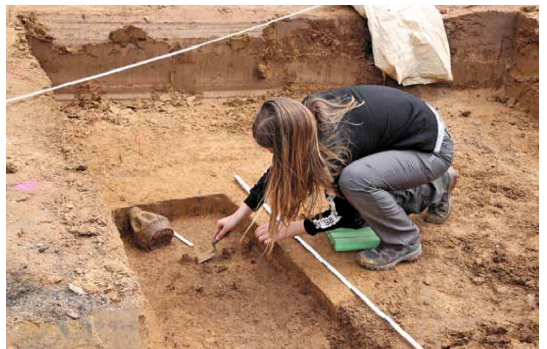
Eine Mitarbeiterin des Denkmallamts Frankfurt legt mit einer scharf angeschliffenen Kelle vorsichtig ein Grab frei. Deutlich zu erkennen ist der römische Faltenbecher, ein Tongefäß, das dem Toten mit ins Grab gegeben wurde,

nur ein Grab, sondern gleich ein kompletter römischer Friedhof freigelegt. Das sind Funde von unschätzbarem Wert.“