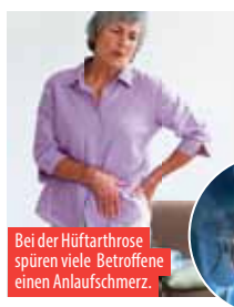
Bei der Hüftarthrose spüren viele Betroffene einen Anlaufschmerz.

in Leiste und Gesäß. Fortgeschritten führt sie zum Hinken und Ausstrahlen der Schmerzen ins Bein.