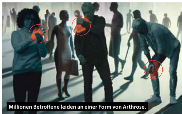
Millionen Betroffene leiden an einer Form von Arthrose.

Beginnt mit eingeschränkter Beweglichkeit und Schmerzen