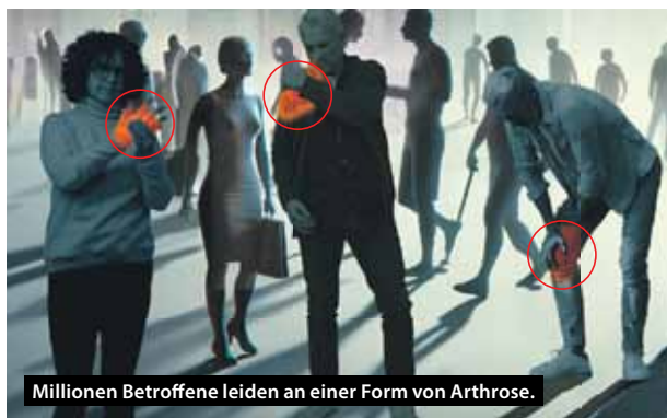
Millionen Betroffene leiden an einer Form von Arthrose.

Beginnt mit eingeschränkter Beweglichkeit und Schmerzen