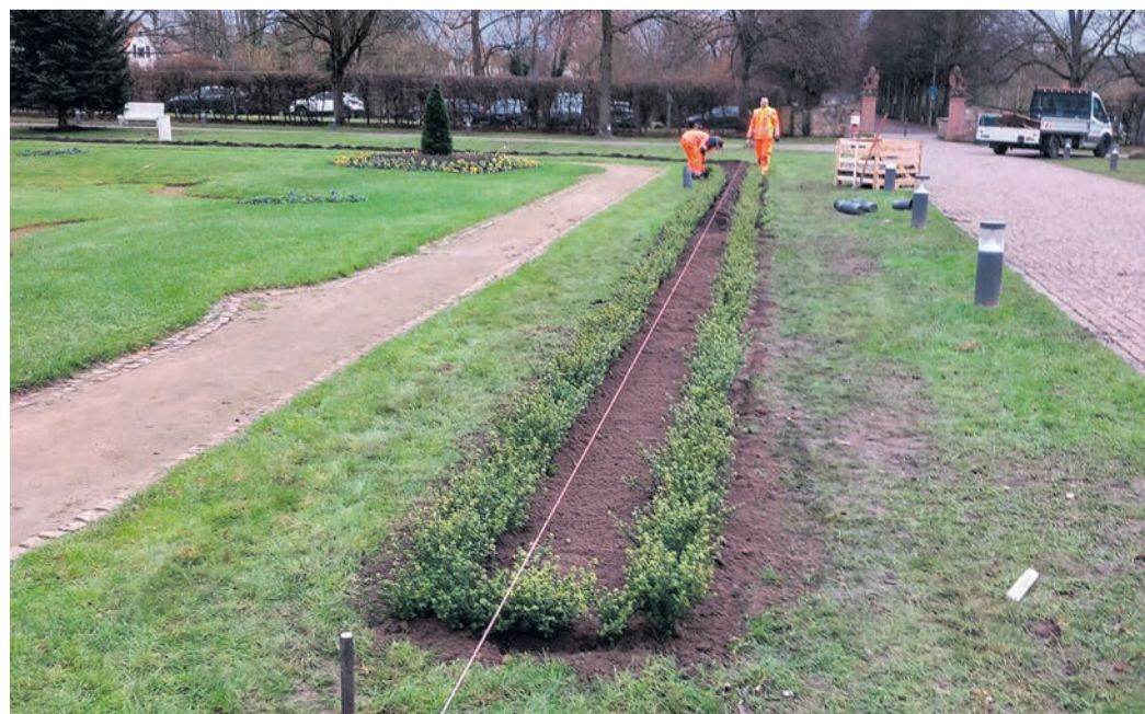
Die neuen Pflanzen werden eingesetzt.

Die Pflanzen dürfen sich jetzt an ihren neuen Standort gewöhnen und werden im Laufe des späten Frühjahrs mit einem Heckenschnitt in Form gebracht.