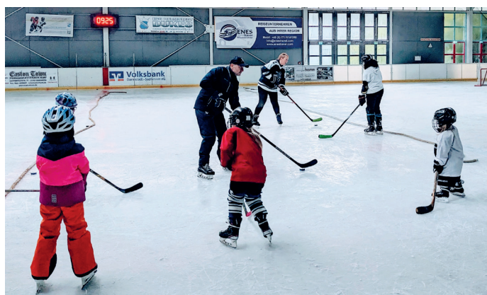
Neugierige Kinder verschiedenen Alters, die beim Schnuppertraining im letzten Herbst das Schlittschuhfahren und Handhaben eines Pucks ausprobiert haben.

Für das Schnuppertraining am 22.01.2025 braucht man keine Vorkenntnisse und keine Ausrüstung. Wer hat, kann sehr gerne eigene Schlittschuhe, einen Helm (z.B. Fahrrad- oder Reithelm) und