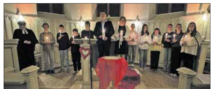
Konfitaufe in Stockstadt.