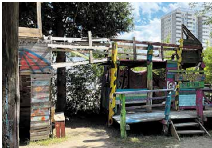
Ein kleiner Abschnitt des Spielplatzes

Der Ginnheimer Fernsehturm, auch bekannt als „Ginnheimer Spargel“, ist das unbestrittene Wahrzeichen des Stadtteils. Mit seiner Höhe von 337,5 Metern dominiert er nicht nur die Skyline Ginnheims, sondern ist auch weithin sichtbar. Erbaut in den 1970er Jahren, dient er