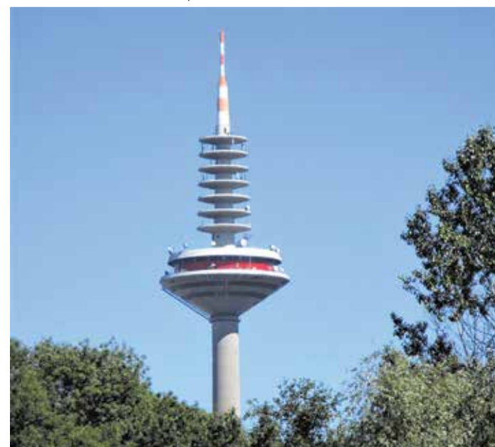
Europaturm Frankfurt am Main (fotografiert im Volkspark Niddatal)