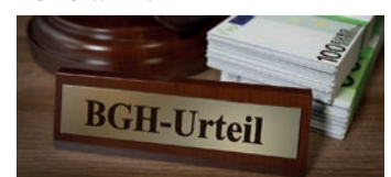
Es geht um viel Geld

rungsverträge auch heute noch anfechtbar. Man nennt dies „ewiges Widerrufsrecht“. Bei einem Widerruf erhalten Sie – anders als bei der Kündigung – alle eingezahlten Beiträge ohne Abzug von Maklerprovisionen und Verwaltungskosten zurück. Und nicht nur das: die Versicherung muss Sie auch an dem mit Ihrem Geld erzielten Anlagegewinn beteiligen. So können Sie bis zu 150% der eingezahlten Beiträge zurückholen. Ein sattes Plus auf Ihrem Konto winkt!