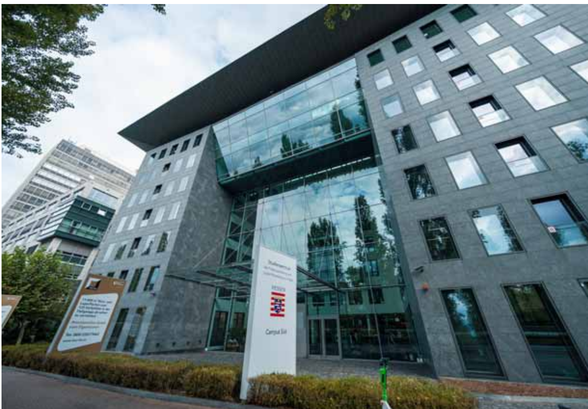
Das moderne Campus Gebäude lädt Besucherinnen und Besucher ein, sich über aktuelle Studiengänge und Ausbildungsmöglichkeiten in der Finanzverwaltung zu informieren.

Alle Interessierten sind herzlich eingeladen!