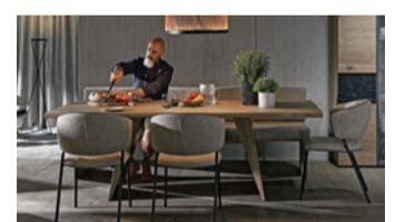
Voglauser Naturholzmöbel sind perfekt für alle, die sich ein Stück Alpenfeeling in ihr Esszimmer holen wollen.