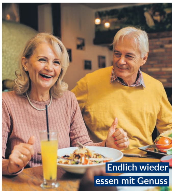
Endlich wieder essen mit Genuss

Bei Blähungen, Völlegefühl und Magenkrämpfen bringen GASTEO Magen-Tropfen mit sechs