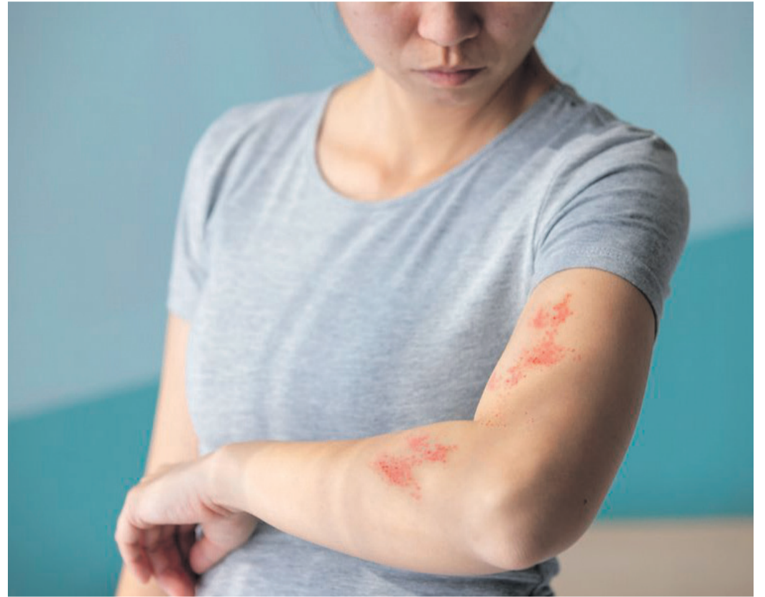
Hautausschlag kann ein äußerliches Symptom der Gürtelrose sein. Schlimmer sind für viele Betroffene die oft lang anhaltenden Schmerzen, die durch die Entzündung der Nerven verursacht werden.