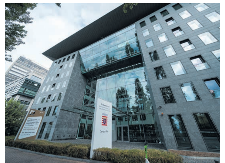
Das moderne Campus Gebäude lädt Besucherinnen und Besucher ein, sich über aktuelle Studiengänge und Ausbildungsmöglichkeiten in der Finanzverwaltung zu informieren.