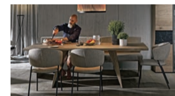
Voglauser Naturholzmöbel sind perfekt für alle, die sich ein Stück Alpenfeeling in ihr Esszimmer holen wollen.