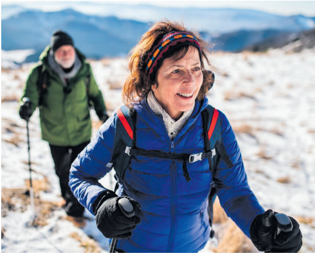
Viele Menschen zwischen 50 und 60 Jahren fühlen sich jünger, als sie tatsächlich sind. Aufgrund der eigenen Alterswahrnehmung unterschätzen diese Personen häufig ihr Gürtelrose-Risiko.

Gürtelrose ist es, das Bewusstsein für diese weitverbreitete, aber oft unterschätzte Erkrankung zu schärfen. Gerade ab einem Lebensalter von 50 aufwärts ist Vorsorge besonders wichtig, um die Lebensqualität möglichst lange zu erhalten. Die Ständige Impfkommission (STIKO) empfiehlt eine Gürtelrose-Impfung für alle Personen ab 60 Jahren sowie bereits ab 50 Jahren für Menschen mit einer Grunderkrankung wie zum Beispiel Diabetes, Asthma, COPD, Rheuma oder Krebs.