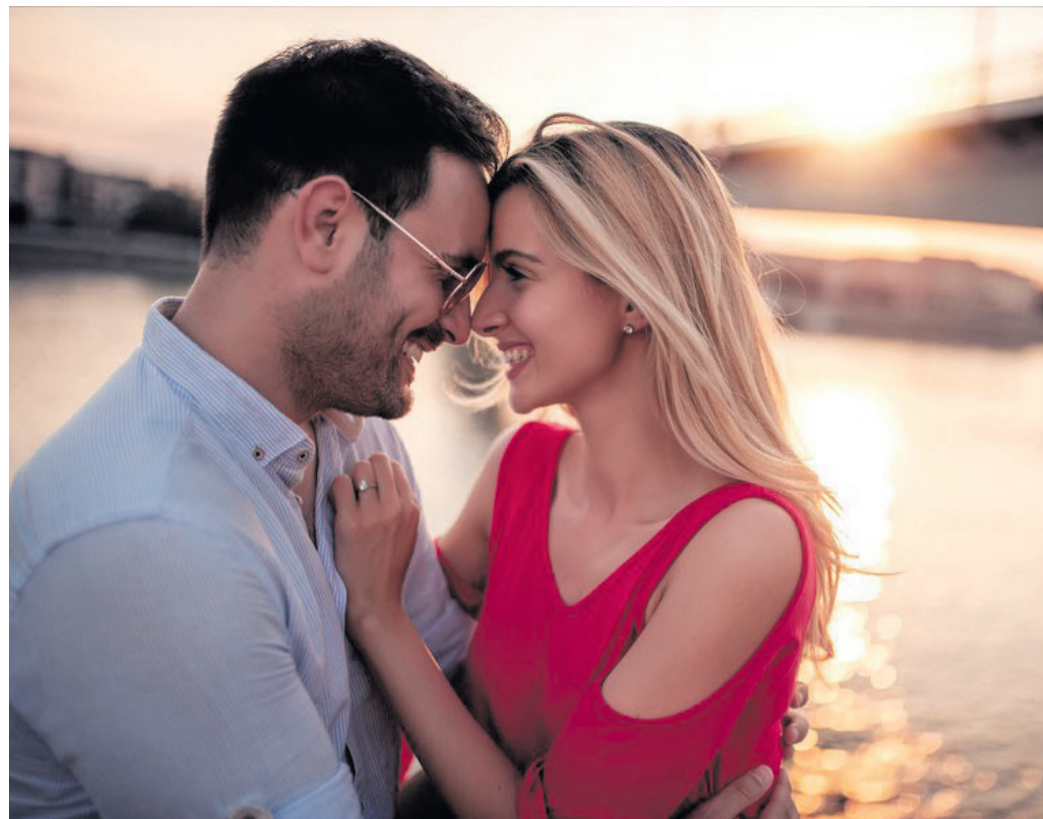
Gemeinsam sind wir stark: Bei einem romantischen Kurzurlaub gibt es immer wieder die ganz besonderen Momente.