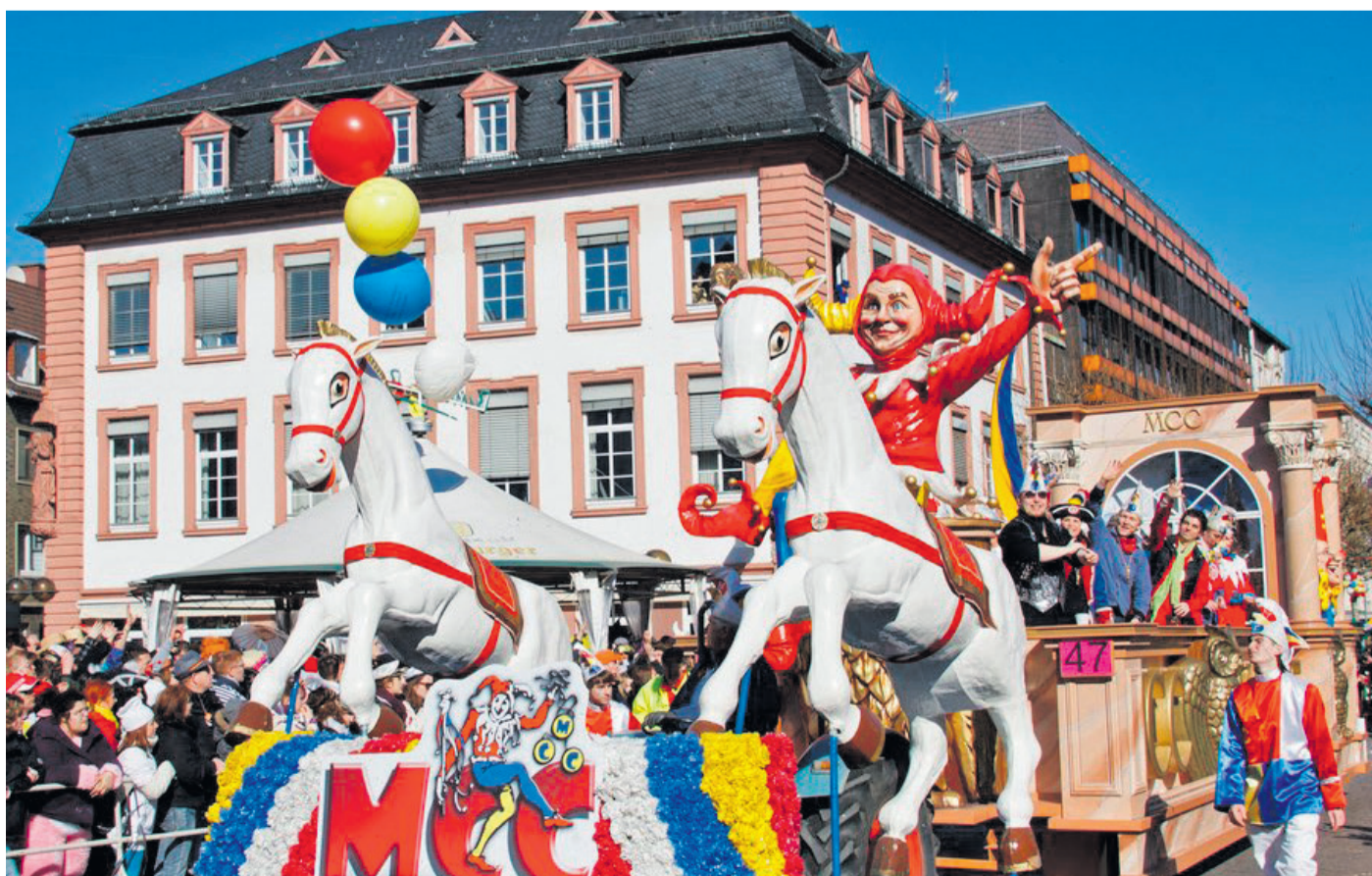
In der „fünften Jahreszeit“ sollten nicht nur die Fahrer der Karnevalswagen nüchtern bleiben, sondern auch alle anderen Jecken, die noch ein Fahrzeug führen wollen.

In diesem Fall reichen fünf Stunden Schlaf nicht aus, um wieder fahrtüchtig zu sein.“ Im Zweifel gilt dann immer: Nicht närrisch handeln und das Auto lieber stehen lassen.