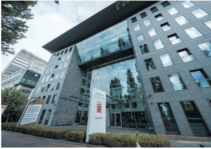
Das moderne Campus Gebäude lädt Besucherinnen und Besucher ein, sich über aktuelle Studiengänge und Ausbildungsmöglichkeiten in der Finanzverwaltung zu informieren.