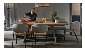
Voglauser Naturholzmöbel sind perfekt für alle, die sich ein Stück Alpenfeeling in ihr Esszimmer holen wollen.