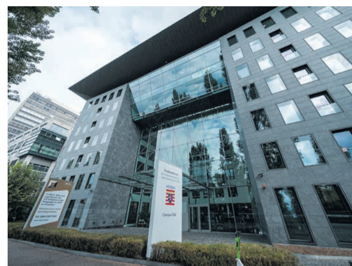
Das moderne Campus Gebäude lädt Besucherinnen und Besucher ein, sich über aktuelle Studiengänge und Ausbildungsmöglichkeiten in der Finanzverwaltung zu informieren.