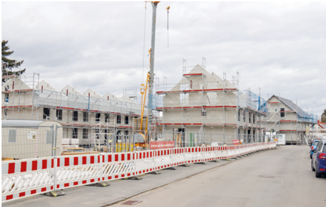
Die Baustelle Erzhäuser Straße in Wixhausen. Bis 1983 starteten hier LKWs. Jetzt sind 23 Wohneinheiten in 7 Häusern im Bau.