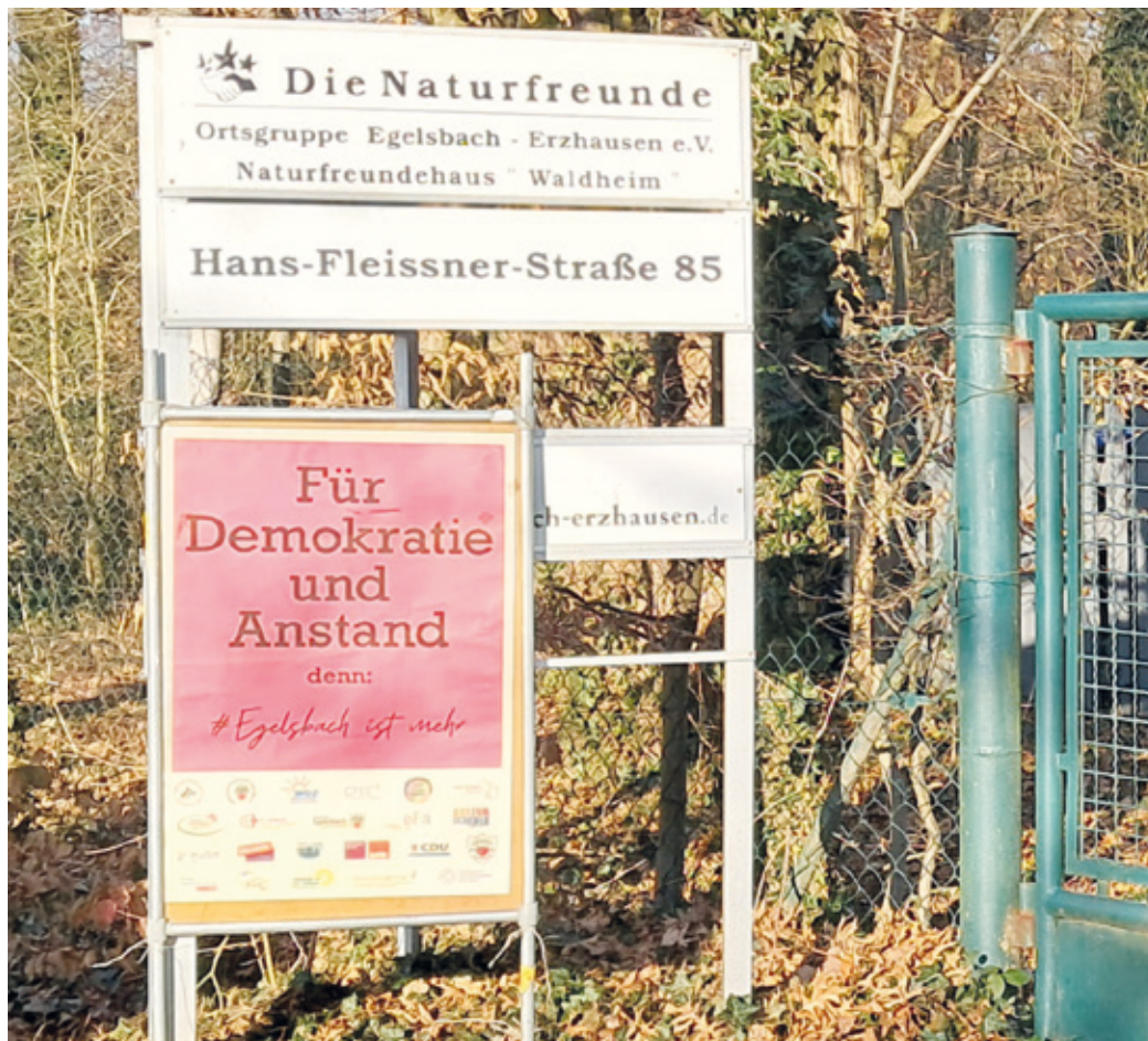
Plakat am Naturfreundehaus.