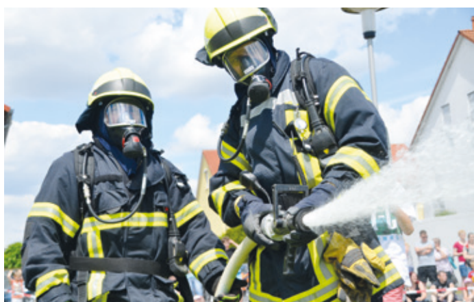
Atemschutzgeräteträger der Freiwilligen Feuerwehr Erzhausen in Aktion – hier zum Glück nur bei einer Schauübung.

Doch offensichtlich setzt sich die hohe Einsatzbelastung auch in 2025 fort. So gab es in den ersten drei Wochen des neuen Jahres bereits 6