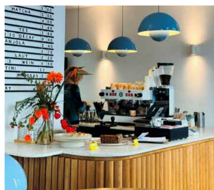
Der gemütliche Innenraum des Cafés

Entdecken Sie das Café DOT. Hier erwartet Sie nicht nur exzellenter Specialty Coffee, sondern auch eine Auswahl köstlicher Bagels – eine Seltenheit in Frankfurts Café-Szenen. Das stilvolle Interieur mit hellen Wänden, schwarzen Metallstühlen und zartblauen Lampen schafft eine einladende Atmosphäre. Das DOT ist täglich von 10 bis 18 Uhr geöffnet, perfekt für einen entspannten Brunch oder Nachmittagsnack.