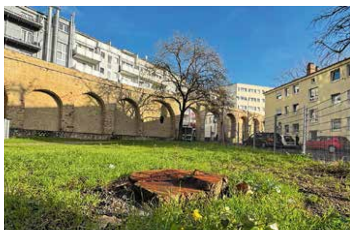
Die Staufeuermauer im Dezember 2024

Der aktuell brachliegende, stark verdichtete und rund 380 Quadratmeter große Platz wird in eine begehbare Blühwiesenfläche umgewandelt. Den Kern bildet künftig eine zentrale Platzmitte mit halbkreisförmig angeordneten, quaderförmigen Sitzgelegenheiten aus Kalkstein. Zum bereits dort stehenden japanischen Schnurbaum werden