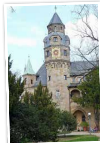
Der Hauptturm der Villa Liebieg

Tauchen Sie ein in die faszinierende Welt der Bildhauerei im Liebieghaus! In einer ma-