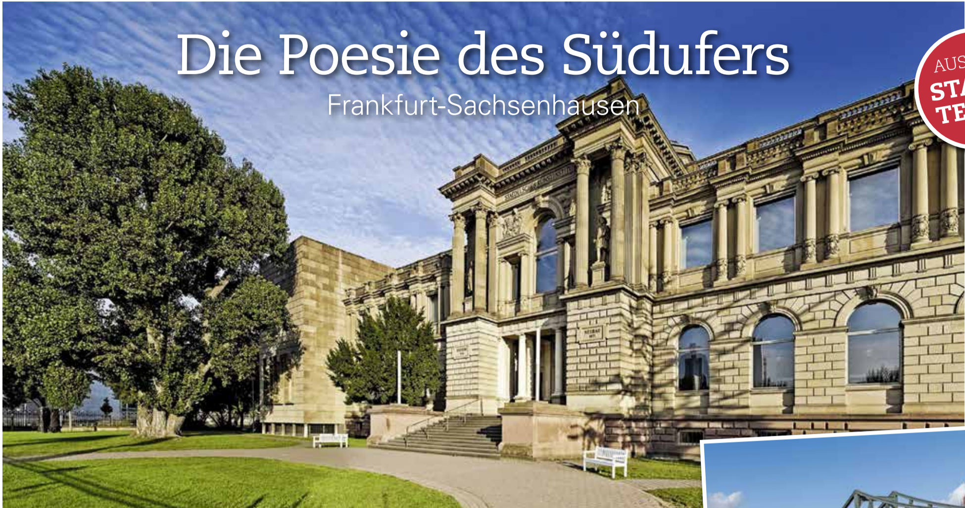
Das Stadel Museum am Museumsufer