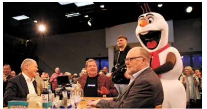
Nun ist auch Olaf der Schneemann mit von der Partie.

Die Sendung ist jetzt online abrufbar unter: www.bembel-und-gebabbel.de Am 4. Februar