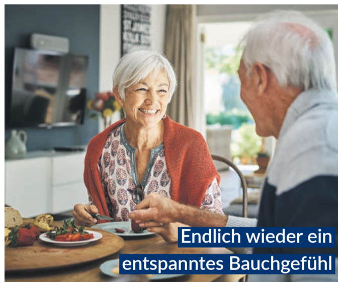
Endlich wieder ein entspanntes Bauchgefühl

Magen-Tropfen, sorgen sechs clever kombinierte natürliche Wirkstoffe für eine deutlich spürbare, schnelle „Erste Magen- und Verdauungshilfe“. Bitterstoffe aus Wermut-, Benediktenkraut und Angelikawurzel steigern rasch die Speichelproduktion und stoßen im Magen-Darm-Trakt die Produktion von Gallensaft und Magensäure an. 1,2 Dank Gänsefingerkraut, Süßholzwurzel sowie Kamillenblüten entspannen Magen und Darm.