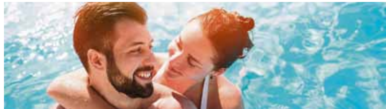
Ein privater Pool ist mit Komplettssystemen schnell installiert. Er sorgt an heißen Sommertagen für viel Freizeitspaß – und sollte rechtzeitig geplant werden.

- Wer ein Schwimmbecken plant, hat mehrere Möglichkeiten, die Badesaison energiesparend und damit umweltfreundlich zu verlängern: 1. Eine Poolüberdachung hält das Wasser auch dann angenehm warm, wenn keine sommerlichen Außentemperaturen herrschen. 2. Um den Pool an kühlen Tagen nutzen zu können, ist eine Wärmepumpe die perfekte Ergänzung. 3. Am umweltfreundlichsten sorgt eine Solarheizung für die Wassererwärmung.