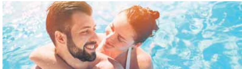
Ein privater Pool ist mit Komplettssystemen schnell installiert. Er sorgt an heißen Sommertagen für viel Freizeitspaß – und sollte rechtzeitig geplant werden.

- Wer ein Schwimmbecken plant, hat mehrere Möglichkeiten, die Badesaison energiesparend und damit umweltfreundlich zu verlängern: 1. Eine Poolüberdachung hält das Wasser auch dann angenehm warm, wenn keine sommerlichen Außentemperaturen herrschen. 2. Um den Pool an kühlen Tagen nutzen zu können, ist eine Wärmepumpe die perfekte Ergänzung. 3. Am umweltfreundlichsten sorgt eine Solarheizung für die Wassererwärmung.