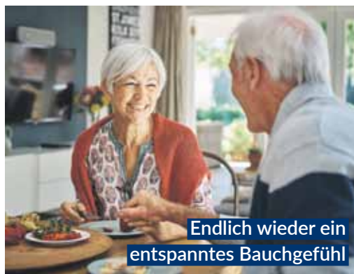
Endlich wieder ein entspanntes Bauchgefühl

Magen-Tropfen, sorgen sechs clever kombinierte natürliche Wirkstoffe für eine deutlich spürbare, schnelle „Erste Magen- und Verdauungshilfe“. Bitterstoffe aus Wermut-, Benediktenkraut und Angelikawurzel steigern rasch die Speichelproduktion und stoßen im Magen-Darm-Trakt die Produktion von Gallensaft und Magensäure an. 1,2 Dank Gänsefingerkraut, Süßholzwurzel sowie Kamillenblüten entspannen Magen und Darm.