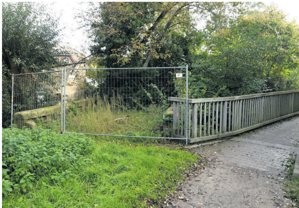
Die Brücke über die Semme bei Altheim (links im Bild der beschädigte historische Teil, rechts die neue Holzbrücke) säumt seit rund einem Jahr ein Bauzaun. Aus dem denkmalgeschützten Teil waren Steine rausgerissen worden. Sie sollen bald wieder eingesetzt und mit Epoxidharz besser befestigt werden.