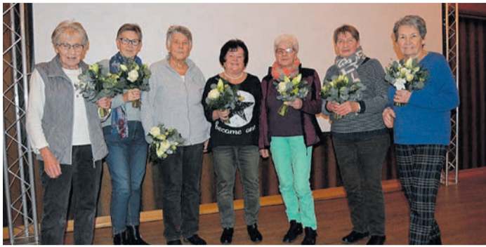
60 Jahre Damengymnastik.