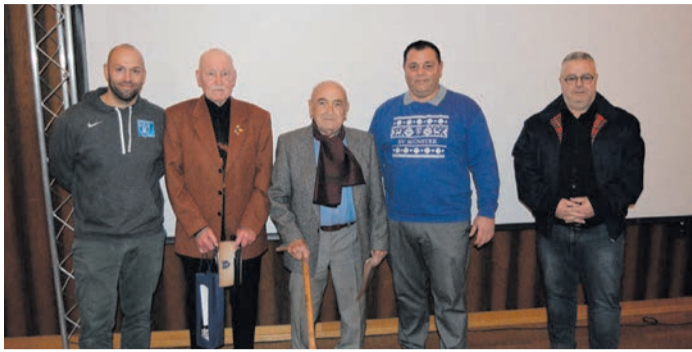
Ehrung für 75-jährige Mitgliedschaft.

Münster (MA) Zahlreiche Gäste und Mitglieder des SV Münster kamen zusammen, um langjährige Mitglieder für ihre Treue und ihr Engagement zu ehren.