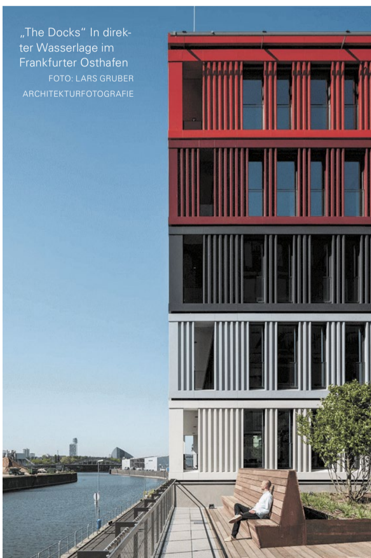
„The Docks“ in direkter Wasserlage im Frankfurter Osthafen

Am Fuße der imposanten EZB erstreckt sich der Hafencampus. Auf vier Hektar vereint er Bewegung und Erholung in perfekter Symbiose. Sportbegeisterte finden hier ein Eldorado: Von Ballsporthallen über anspruchsvolle Fitnessparcours bis hin zu einem State-of-the-Art Skatepark. Gleichzeitig laden weitläufige Grünflächen zum Picknicken und Sonnenbaden ein. Der Park pulsiert besonders