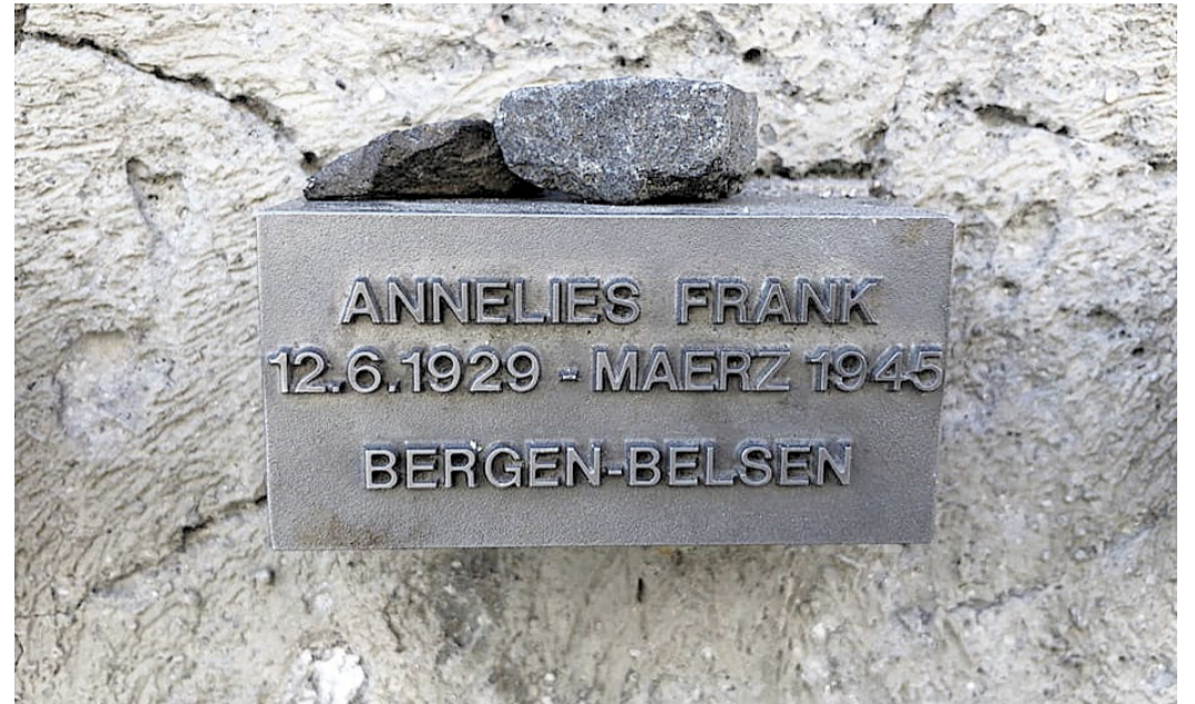
Gedenkstein für Anne Frank an der Gedenkstätte Börneplatz. Ihr Todeszeitpunkt im Konzentrationslager Bergen-Belsen wird auf März 1945 geschätzt. Am 15. April 1945 befreiten britischen Truppen die dort gefangen gehaltenen überlebenden Menschen

Zum 80. Jahrestag der Befreiung des Konzentrationslagers Auschwitz