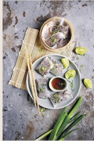
Die vietnamesische Dumplingrolle „Banh Cuon“ aus dem Kochbuch.

Auch an der Entwicklung unseres Kochbuchs „Frankfurt is(s)t bunt“ war ich beteiligt. Als die Idee entstanden ist, gab es direkt so ein großes Interesse von Ehrenamtlichen, die mitmachen wollten. Es wurden dann Rezeptideen aus aller Welt vorgestellt und in der Gruppe ausgewählt. Wir haben die 97 Gerichte na-