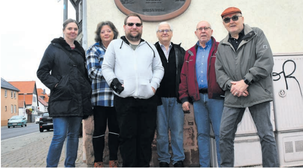
Eine Arbeitsgruppe (hier sechs der zehn Beteiligten an der Gedenktafel für jüdische NS-Opfer am Münsterer Storchenschulhaus) hat die Schicksale von 19 vertriebenen, deportierten oder ermordeten Münsterern und Altheimern recherchiert. Am 6. April werden an acht Adressen 19 „Stolpersteine gegen das Vergessen“ verlegt.