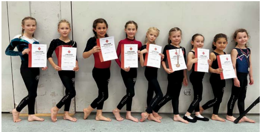
Die Jüngsten zeigten tolle Leistungen