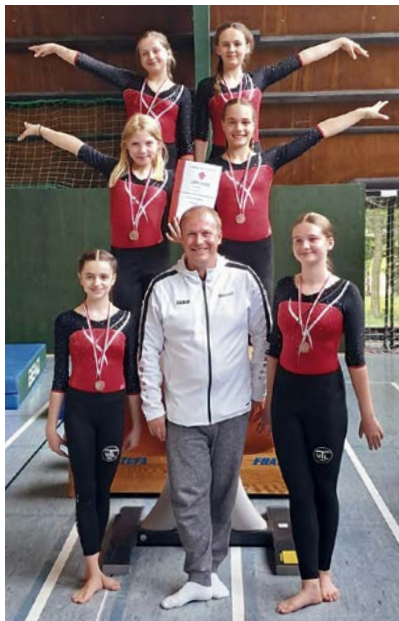
Bronze für die P6-P8 Turnerinnen