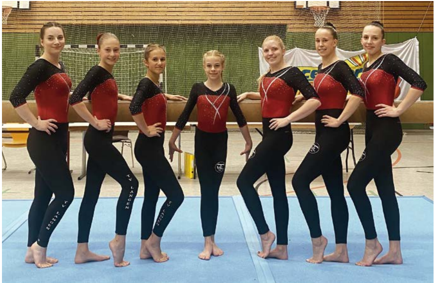
Unsere Landesliga IV Turnerinnen