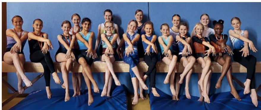
Die Langener Mehrkämpferinnen

Der TVL zieht damit eine sehr zufriedenstellende Bilanz von je zwei Hessenmeisterinnen- und Vizetiteln, fünf Bronzerängen, sowie einer Qualifikation zu den Deutschen Mehrkampfmeisterschaften, die im September im rheinland-pfälzischen Pirmasens ausgetragen werden.