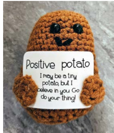
Die „Positive Potato“ machte gute Laune

Spaß und Spiel kamen bei der Veranstaltung ebenfalls nicht zu kurz: So versuchten sich die Teilnehmerinnen und Teilnehmer bei verschiedenen Selbstverteidigungsübungen und Sportarten. Dazu gehörte auch, das besonders agile Säbelfechten kennenzulernen und selbst einmal auszu probieren. Für alle gab es am Ende Erfrischungen und eine kleine Aufmerksamkeit. Mit diesen Präsenten und jeder Menge Anregungen konnten die Kinder gut in den Ferienbeginn starten. Da können wir nur sagen: „Fünf zu null im inneren Gefecht!“