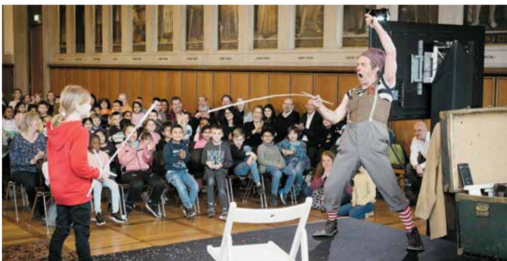
En garde! Ein Kind beim Zollstock-Duell mit Clown „Herr Bauch“ während des Neujahrsempfangs für Kinder.

chen. In der Schule passiert das bereits durch die Schüler:innenvertretungen, die beispielsweise auch bei der Gestaltung von Schulhöfen oder in Mensaräten an Schulen mitwirken. Bei der Spielplatzaktion SPATZ bringen Kinder bei der Gestaltung von Spielplätzen ihre Idee mit ein. Aber es gibt auch viele Bereiche, in denen diese Beteiligung noch zu kurz kommt. Daher bin ich dankbar, dass wir seit vielen Jahren mit dem Kinderbüro einen kompetenten und erfahrenen Partner haben, der sich für Kinderrechte einsetzt und dafür sorgt, dass junge Menschen ihre Lebenswelten mitgestalten können. Und ich begrüße es, dass die jungen Frankfurterinnen und Frankfurter einen eigenen Neujahrsempfang im Römer erleben können.“ Auf Anregung von Kita Frankfurt, die auch das Programm organisierte, wurde der Neujahrsempfang für Kinder in diesem Jahr wiederbelebt. Weitere Informationen zum Frankfurter Kinderbüro und der Stadt der Kinder sowie zum Programm der Kampagne finden sich unter Stadt der Kinder.