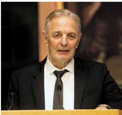
Rekord-Bundesligaspieler und Eintracht-Legende Karl-Heinz „Charly“ Körbel während seiner Rede im Kaisersaal anlässlich des Empfang zu seinen Ehren.