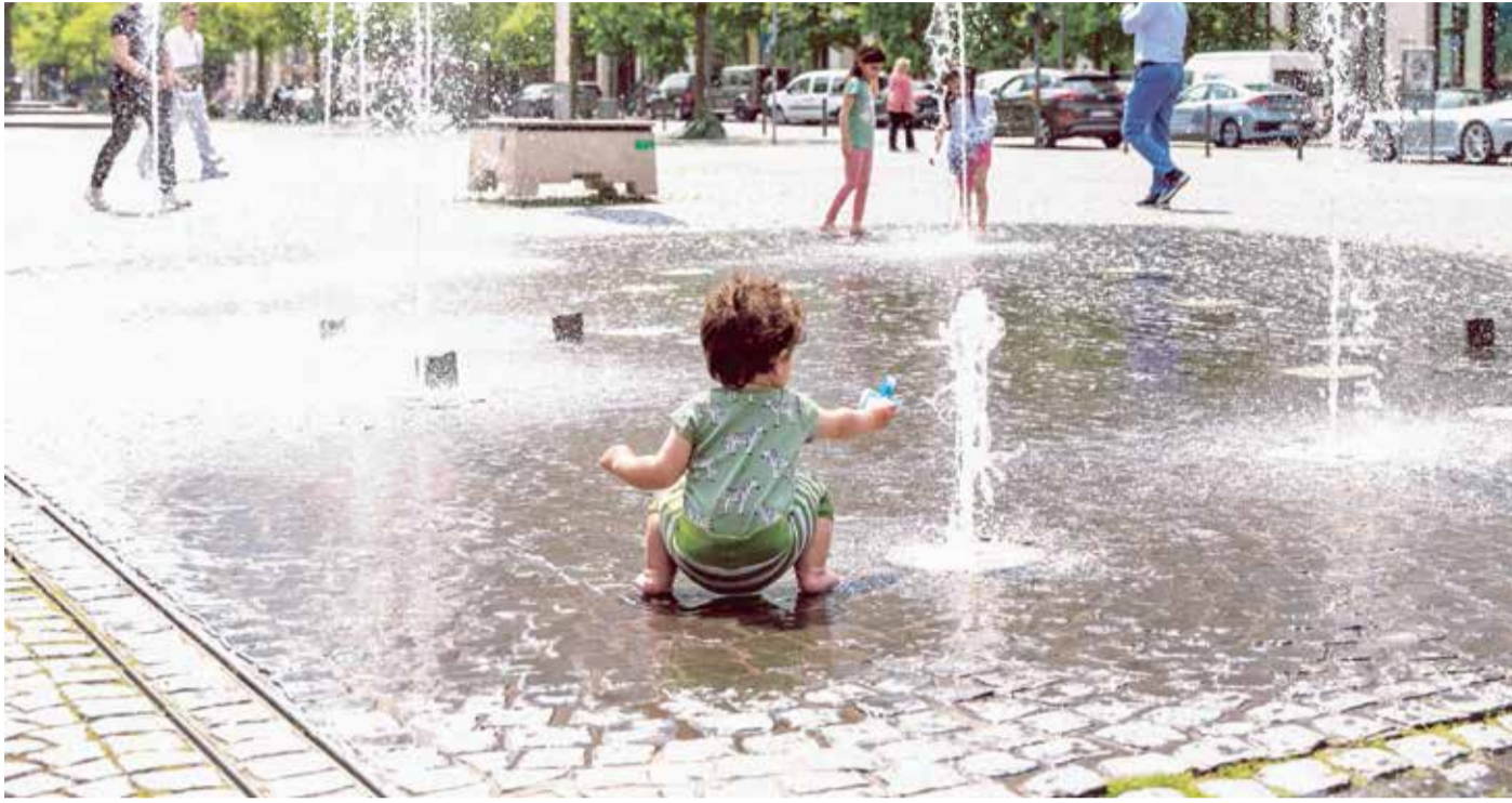
Erholung von der Sommerhitze an kühlen Orten in der Stadt.

Gesundheitsamt will 2025 erstmals Klimalotsinnen und -lotsen ausbilden