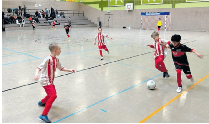
Mehr als 300 Spielerinnen und Spieler konnte der FVE zum Turnier begrüßen.

Am Samstagvormittag standen sich dabei acht F2-Jugendmannschaften des Jahrgangs 2017 zu ihrem Masters-Turnier in der Sporthalle gegenüber. Für viele der Spielerinnen und Spieler war es das erste Hallenturnier, aber es war gleich zu sehen, wieviel die Kids in den 1-2 Jahren schon gelernt haben und die Zuschauerinnen und Zuschauer hatten viel Spaß bei