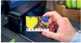
Jetzt bei EDEKA wertvolle PAYBACK Punkte sammeln

Bei EDEKA gibt es jetzt für jeden Einkauf 1 PAYBACK Punkt pro 2 Euro