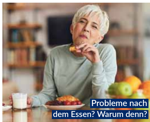
Probleme nach dem Essen? Warum denn?

Tropfen mit ihrer einzigartigen Kombination aus beruhigenden und bitterstoffhaltigen Heilpflanzen sorgen für schnelle Linderung. Direkt nach dem Essen eingenommen, aktivieren Bitterstoffe, z.B. enthalten in Wermut-, Benediktenkraut und Angelikawurzel, die Verdauungssäfte. 1,2 Krampflösendes Gänsefingerkraut, zusammen mit Süßholzwurzel und Kamillenblüten, entspannt den gesamten Magen-Darm-Trakt.