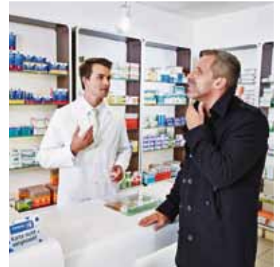
Halsschmerzen, Schnupfen und Husten: In der Apotheke gibt es guten Rat für die gezielte Linderung.

Kurze Tage, Dunkelheit und schlechtes Wetter drücken vielen Menschen aufs Gemüt. Umso wichtiger ist es rauszugehen. Täglich 30 Minuten draußen aktiv sein, möglichst bei Tageslicht, fördert nicht nur die Durchblutung der Schleimhäute in den Atemwegen, sondern wirkt