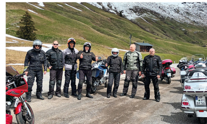
Nicht nur die aussichtsreichen Fahrten genießen, auch die Pausen

Vom 16. bis 21.05.23 trafen sich über Christi Himmelfahrt mehr als 50 begeisterte Motorradfahrer/-innen zu einer gemeinsamen Freizeit und tollen Ausfahrten mit dem Motorrad in Lindenberg im Allgäu. Untergebracht waren wir im Humboldt-Jugendgästehaus Lindenberg.