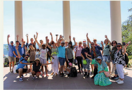
Gute Laune unter den Ausflüglern

hausen. Denn mit dem Schiff ging es dann auf dem Rhein zurück nach Rüdesheim. Einige verweilten noch in der Stadt, die anderen fuhren mit dem Zug zurück nach Hause. Dieser Ausflug bot vielfältige Möglichkeiten, sich (besser) kennenzulernen, Kontakte zu knüpfen, Neues zu entdecken oder einfach einen schönen Tag mit sympathischen Leuten zu verbringen. Ein Hope-Center-Gast erzählte, er habe sich angemeldet, weil er bisher nur nette Menschen im Hope Center kennengelernt habe. Einige Besucher unseres Trauercafés nutzten die Gelegenheit gerne, »um mal wieder rauszukommen. Denn alleine macht man ja nichts. Macht ja keinen Spaß.« Und die jugendlichen Geflüchteten, die im Hope Center Deutsch lernen, haben jetzt Bekanntschaft mit den Pfadis ge-