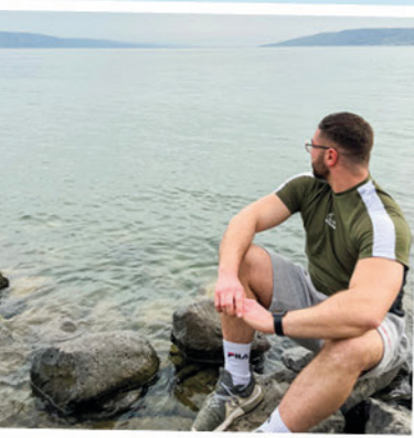
Zuversichtlich in die Zukunft