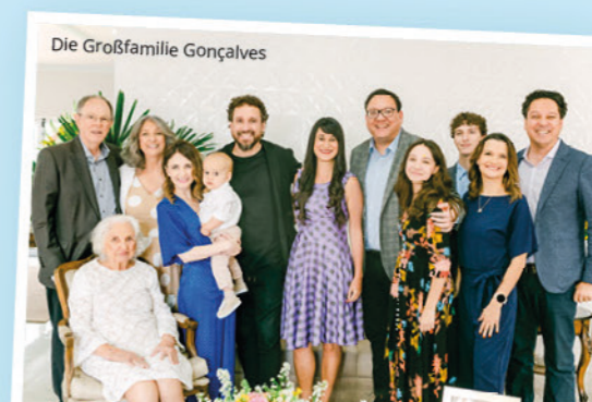
Die Großfamilie Gonçalves