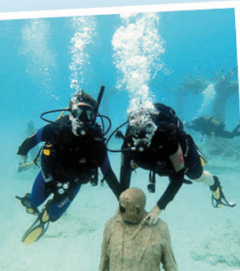
Ein neues gemeinsames Hobby – tauchen