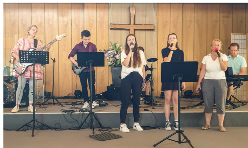
Einladen mit Musik – die Musikerinnen und Musiker von ComingHOME