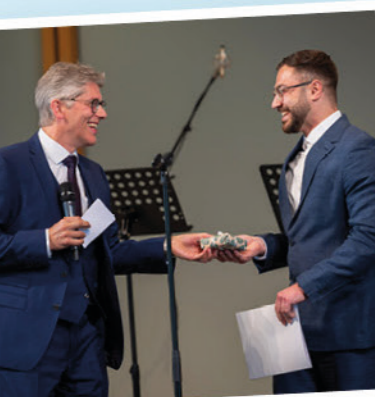
Das Studium ist geschafft